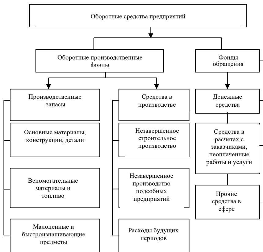
Рис. 10.2. Состав оборотных средств

В отличие от основных оборотные производственные средства принимают участие только в одном производственном цикле, целиком потребляются в процессе производства, теряют при этом свою натуральную форму и полностью переносят свою стоимость на изготовленный продукт. В зависимости от характера участия в процессе создания продукции различают оборотные производственные средства и фонды обращения (рис. 2).