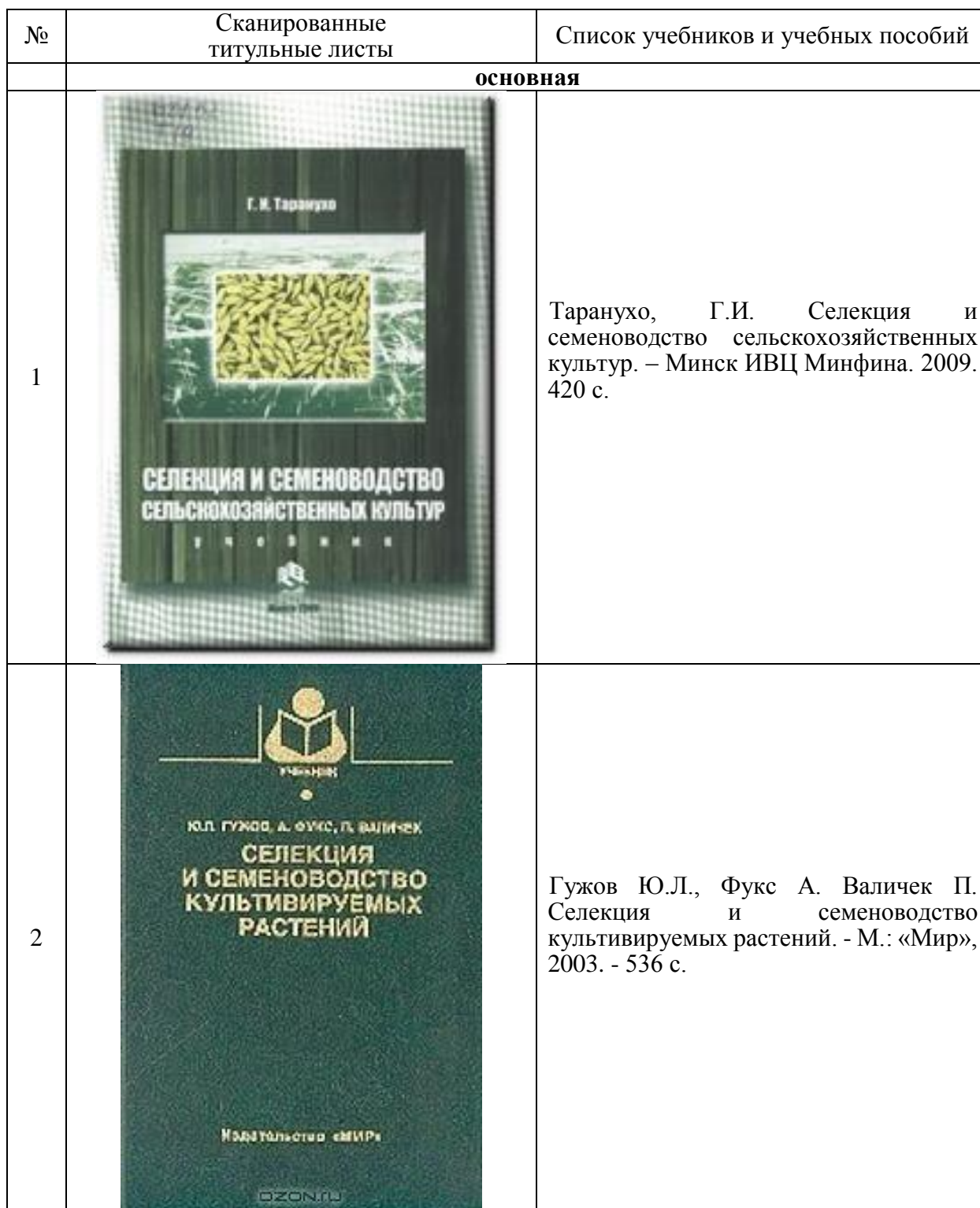
Таблица 1.1. Учебники и учебные пособия

В табл. 1.1. представлены основные учебники и учебные пособия для изучения теоретической части дисциплины «Семеноводство сельскохозяйственных растений».