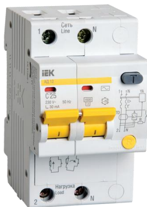
Рис.5.4. Дифференциальный автомат IEK 2п 25А/30мА АД-12

Мгновенное срабатывание автоматического выключателя происходит при перегрузке кратной 10 от номинального тока отсечки автомата. По требованиям ПУЭ данная группа розеток должна быть защищена не только автоматическим выключателем, но и устройством защитного отключения (УЗО) или же дифференциальным автоматическим выключателем, который представляет собой уникальное устройство, в котором одновременно сочетаются функции автоматического выключателя и защитные свойства УЗО. При этом ток утечки УЗО должен составлять не менее 0,3 А. По произведенным расчетам и требованиям ПУЭ выбираем дифференциальный автомат с номинальным током расцепителя, превышающим значение 22,9 А, и током утечки не менее 0,3 А. Таковым является дифференциальный автомат IEK 2п 25А/30мА АД-12 с номинальным током расцепителя I_{н.р} = 25 \text{ А} (рис. 5.4).