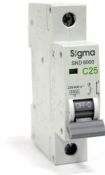
Рис. 5.3. Автоматический выключатель однополюсный 25 А

3. Выбираем автомат с номинальным током I_{н.а} = I_{н.р} = 25 А (рис. 5.3).