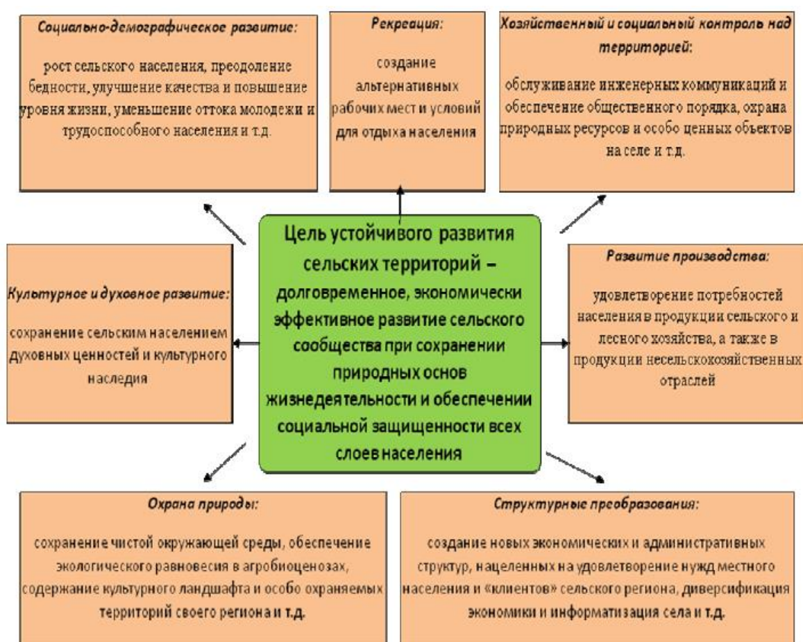
Рис. 1 Цель и задачи устойчивого развития сельских территорий

4. Главная цель устойчивого развития сельских территорий заключается в создании условий для достижения благополучия населения путем формирования саморазвивающейся социоэколого-экономической территориальной системы. Достижение этой цели предусматривает сохранение и приумножение культурного наследия; обеспечение воспроизводства и долговременного использования природных ресурсов и сохранение видового разнообразия, диверсификацию деятельности в сельской местности путем развития местной промышленности, ремесел, промыслов, туризма и других сфер хозяйственной деятельности.