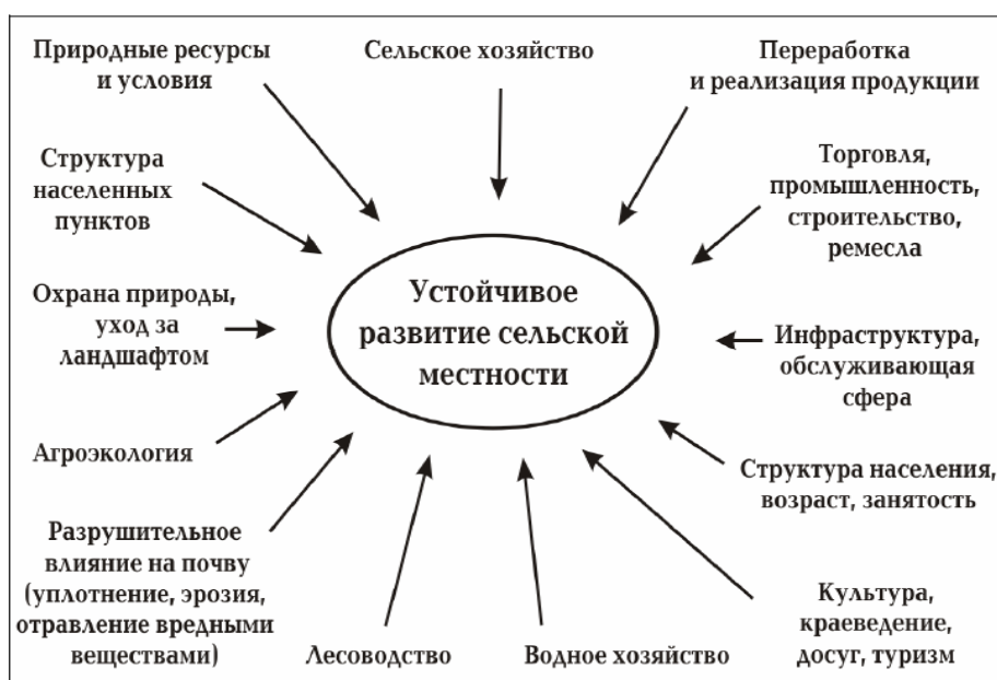
Рис. 2 Исследовательская база устойчивого развития сельской местности

Отраслевые подходы территориального развития воспринимают жителей сельской местности только в соответствии с их определенной ролью: крестьян - как производителей продовольствия, пассажиров автобуса - как участников транспортного движения, больных как пациентов или как пользователей услуг лечебного учреждения и т.д. Однако к людям необходимо серьезно относиться во всех проявлениях их жизненной ситуации.