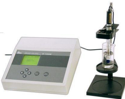
Рис. 22. Ионмер И-160 М

Прежде чем приступить к выполнению работы по потенциметрическому определению рН растворов, необходимо изучить по инструкции устройство, настройку, порядок работы и технику безопасности при работе на соответствующих приборах (рис. 22).