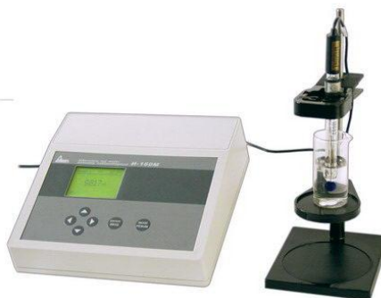
Рис. 1. Ионмер И-160 М

Прежде чем приступить к выполнению работы по потенциометрическому определению pH растворов, необходимо изучить по инструкции устройство, настройку, порядок работы и технику безопасности при работе на соответствующих приборах (рис. 1).