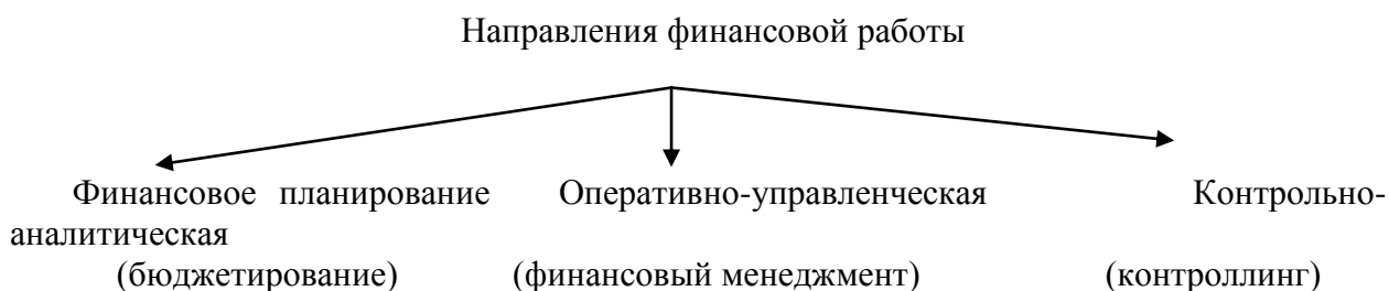
Рисунок 3.3. Направления финансовой работы в организации

Финансовая работа организации сложна и многообразна. При этом, по экономическому содержанию в ней можно выделить три основных направления (рис. 3.3).