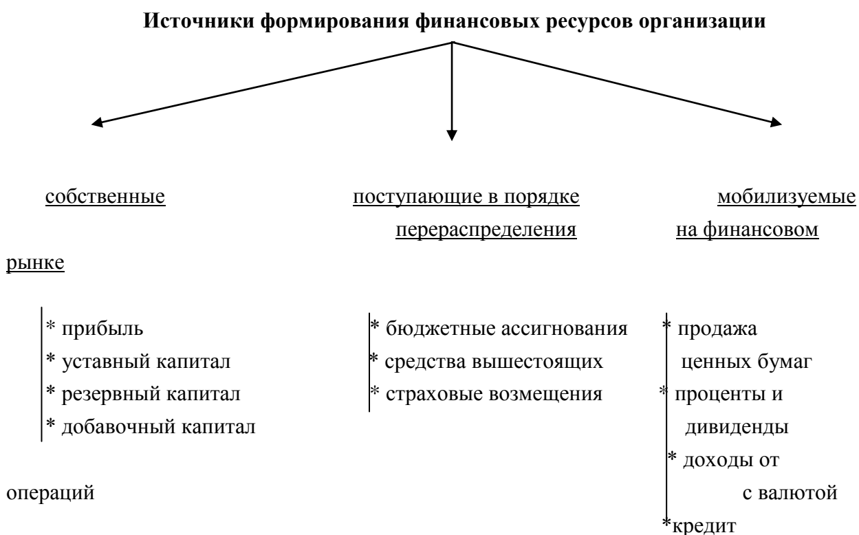
Рисунок 3.1. Источники финансовых ресурсов организаций

Формирование финансовых ресурсов осуществляется за счет собственных средств, мобилизации ресурсов на финансовом рынке, поступления денежных средств от финансовой и банковской системы, а также от вышестоящих органов в порядке перераспределения (рис. 3.1).