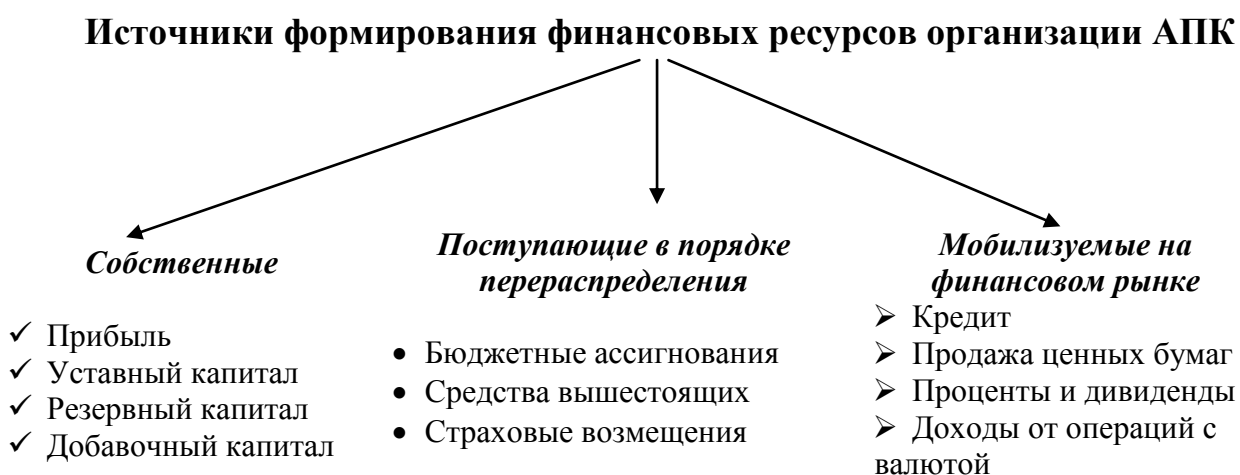
Рисунок 4.1. Источники финансовых ресурсов организации АПК

Формирование финансовых ресурсов осуществляется за счет собственных средств, мобилизации ресурсов на финансовом рынке, поступления денежных средств от финансовой и банковской системы, а также от вышестоящих органов в порядке перераспределения (рис. 4.1).