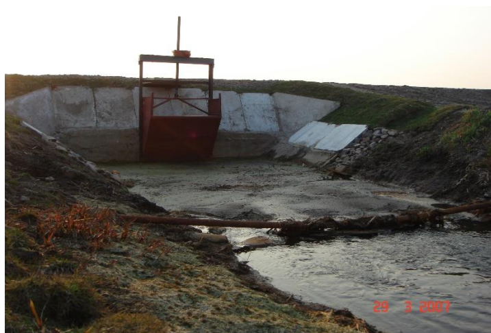
Рис. 10.4. Скопление бузы перед трубой-регулятором.

Каналы, проложенные в торфяных грунтах, в дополнение к перечисленным подвергаются еще и специфическим деформациям. Новые каналы и водоприемники в первые 1...3 года усиленно заиляются измельченными при строительстве остатками торфяной массы, которая стекает с откосов под воздействием воды и давления уплотняющегося торфа. Смесь воды и торфа (буза) продвигается по уклону русла и при встрече с препятствием накапливается, создавая подпор для сброса избыточных вод (рис. 10.4).