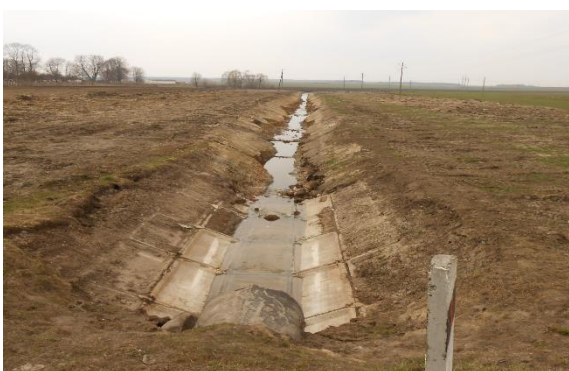
Рис. 10.2. Размыв канала потоком воды.

Значительно деформируются каналы из-за заиления и размыва. Заиление происходит за счет наносов, приносимых поверхностными водами с прилегающей местности, смытых с откосов каналов, принесенных потоком воды из других мест по руслу этих же каналов (рис. 10.2).