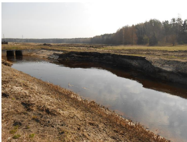
Рис. 10.1. Обрушение откоса канала.

В летний период откосы и дно зарастают травяной и кустарниковой растительностью. В пересыхающих каналах летом поселяются землеройные животные, образуются муравейники, в результате их жизнедеятельности происходит деформация откосов и дна. На осушительно-увлажнительных системах в летний период проводят мероприятия по увлажнению почвы и открытые каналы работают в условиях увлажнения – высыхания. Опасность оползания откосов возникает при сбросе воды после увлажнения. В целях предотвращения этого повреждения откосов необходимо воду сбрасывать с таким расчетом, чтобы уровни воды в канале и уровни грунтовых вод опускались одновременно или с минимальным перепадом.