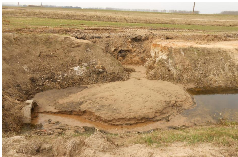
Рис. 10.3. Разрушение откоса канала сосредоточенным стоком.

Наиболее радикальными мерами предупреждения заиления каналов и водоприемника осушительной системы являются противоэрозионные мероприятия, проводимые на мелиорированной территории и на склонах прилегающей местности, а также закрепление откосов водотоков для предотвращения смыва, оплывания и обрушения грунта на дно (рис. 10.3).