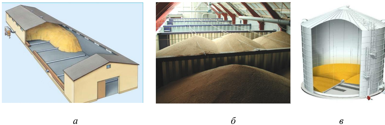
Рис. 4. Способы хранения зерна насыпью: а – напольное; б – закромное; в – силосное

или сортов зерна. Силосом называется емкость для хранения зерна, высота которой более чем в 1,5 раза превышает ее диаметр.