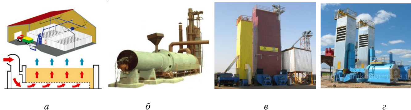
Рис. 2. Типы зерносушилок: а – напольная; б – барабанная; в – шахтная; з – колонковая

По конструктивным особенностям сушильных камер различают сушилки напольные, барабанные, шахтные, колонковые (рис. 2).