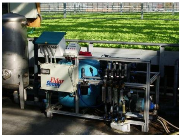
Рис. 2. Оборудование для смешивания растворов

Рабочий раствор рекомендуется получать разведением маточного раствора водой в соотношении 1:100, допустимо 1:50 или 1:200. Растворы А и Б подают одновременно и разбавляют водой до заданной электропроводности рабочего раствора (ЕС).