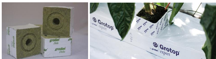
Рис. 1. Минеральная вата

Минеральная вата. Минеральную вату (рис. 1), которую еще называют каменной ватой, производят из базальтовых горных пород или сходных с ними диабазов. Измельченную горную породу смешивают с коксом. Смесь доводят до точки плавления при температуре 1600 °С. Затем из расплавленного материала делают волокна. Длина и толщина волокон – важные факторы, определяющие физические характеристики конечного продукта. Расплавленная горная порода попадает на диски, ее комбинируют с добавками, включающими известняк, смачивающий агент и органический полимер, соединяющий волокна вместе для производства плит. Полимеры обычно производят на основе фенола – материала, похожего на пластичный бакелит. Другие материалы добавляют для обеспечения поглощения воды, хотя водоотталкивающая форма (наиболее часто используемая в качестве изолирующего материала в стройматериалах) также используется в гранулированной форме как составная часть компостных смесей или как материал, добавляемый в почву.