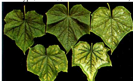
Рис. 4. Признак недостатка магния в листьях огурца

У огурца молодые листья – мелкие, темно-зеленые, междоузлия короткие. Затем с краев молодые листья светлеют, на пластинке листа между жилками возникают узкие светлые полосы. Они расширяются, теряют зеленый цвет, некротизируются. Жилки и прилегающая к ним часть листа сохраняет интенсивно-зеленую окраску, края