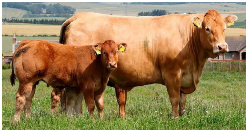
Рис. 4.7. Корова и теленок лимузинской породы

Масть лимузинского скота красная или красно-бурая, светлее под брюхом и в промежности (рис. 4.7, 4.8).