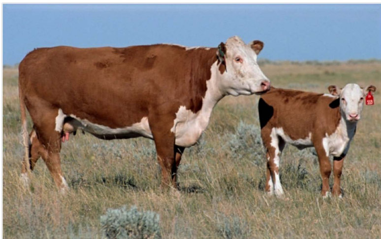
Рис. 4.1. Корова и теленок герефордской породы

устойчиво передаются по наследству. Носовое зеркало, рога и копыта светло-розовой окраски. У большинства животных имеются белые отметины разной величины на холке и спине, но этот признак не считается обязательным. Герефорды по типу телосложения имеют классическую форму, типичную для специализированного мясного скота, – прямоугольную.