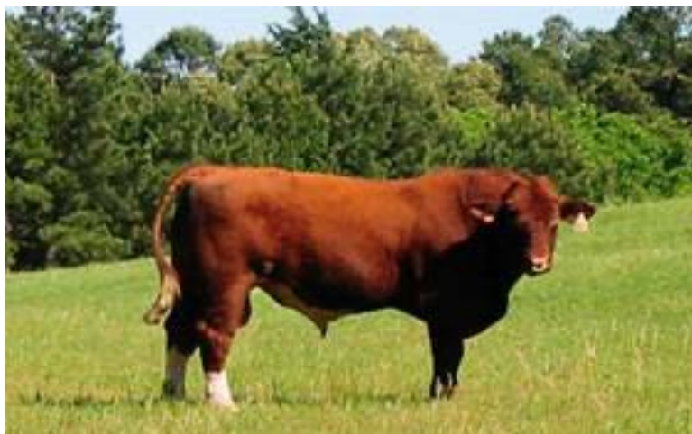
Рис. 4.9. Бык-производитель породы мен-анжу

Спина прямая, поясничная часть достаточно широкая, бедра хорошо развиты, кость очень тяжелый, крестец длинный, грудь глубокая и широкая, подгрудок небольшой, лопатки выпуклые, голова тяжелая, лоб широкий, шея толстая и короткая.