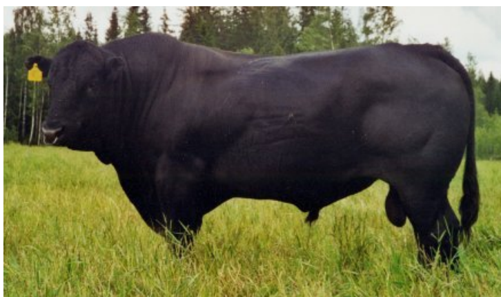
Рис. 4.4. Бык-производитель абердин-ангусской породы