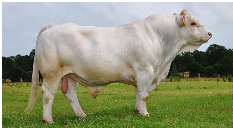
Рис. 4.6. Бык-производитель шаролезской породы

Голова у шаролезского скота небольшая, короткая, с широким лбом, рога короткие. Шея короткая и мясистая; грудь широкая (50–54 см) и глубокая (70–78 см); подгрудок слабо развит; туловище длинное (косая длина туловища составляет 166–170 см) и глубокое, с хорошо развитой мускулатурой, особенно в области спины и задней трети туловища; спина широкая, прямая; поясничная часть и крестец широкие; окорока хорошо выполнены; конечности невысокие; кожа тонкая, мягкая; косяк грубый (обхват пясти – 20–24 см). Высота в холке у коров составляет 133–135 см, быков – от 141 до 145 см. Из недостатков экстерьера встречается провислость спины, раздвоенность холки и приподнятость крестца у корня хвоста.