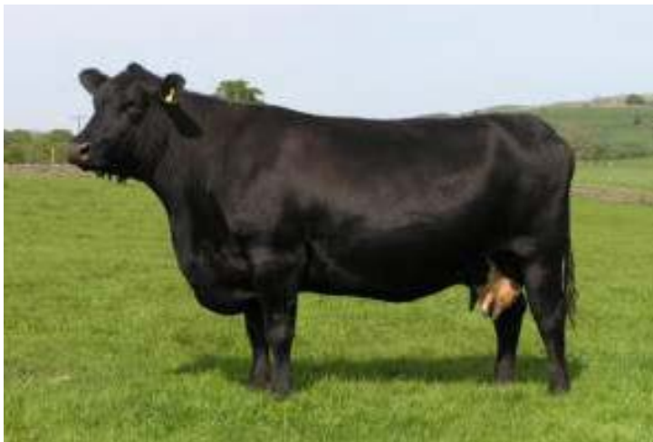
Рис. 4.3. Корова абердин-ангусской породы

Отличительные признаки абердин-ангусской породы – комолость и сплошная черная без отметин масть – устойчиво передаются по наследству при скрещивании с другими породами (рис. 4.3, 4.4).