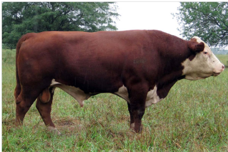
Рис. 4.2. Бык-производитель герефордской породы

в США, но и в Англии. В породе около 70 % животных рогатые, 30 % – комолые. По темпераменту быки-производители очень спокойные и послушные. Коровы также имеют спокойный нрав, у них особенно хорошо развиты материнские качества.