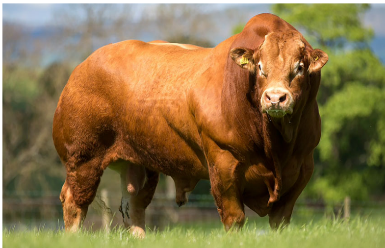
Рис. 4.8. Бык-производитель лимузинской породы

Животные данной породы несколько меньше животных породы шароле, но крупнее и тяжелее, чем мясной скот английских пород. Живая масса быков-производителей составляет 1000–1100 кг, полно-возрастных коров – 580–640 кг. Живая масса бычков при рождении – 36–42 кг, телочек – 34–38 кг, в 8-месячном возрасте – соответственно 260–300 и 240–260 кг.