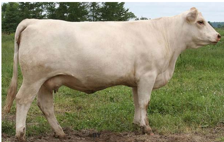
Рис. 4.5. Корова шаролезской породы

Животные шаролезской породы имеют белую масть с желтоватым или кремовым оттенком, без пятен, гармоничное телосложение и крепкую конституцию с хорошо выраженными мясными формами (рис. 4.5, 4.6).