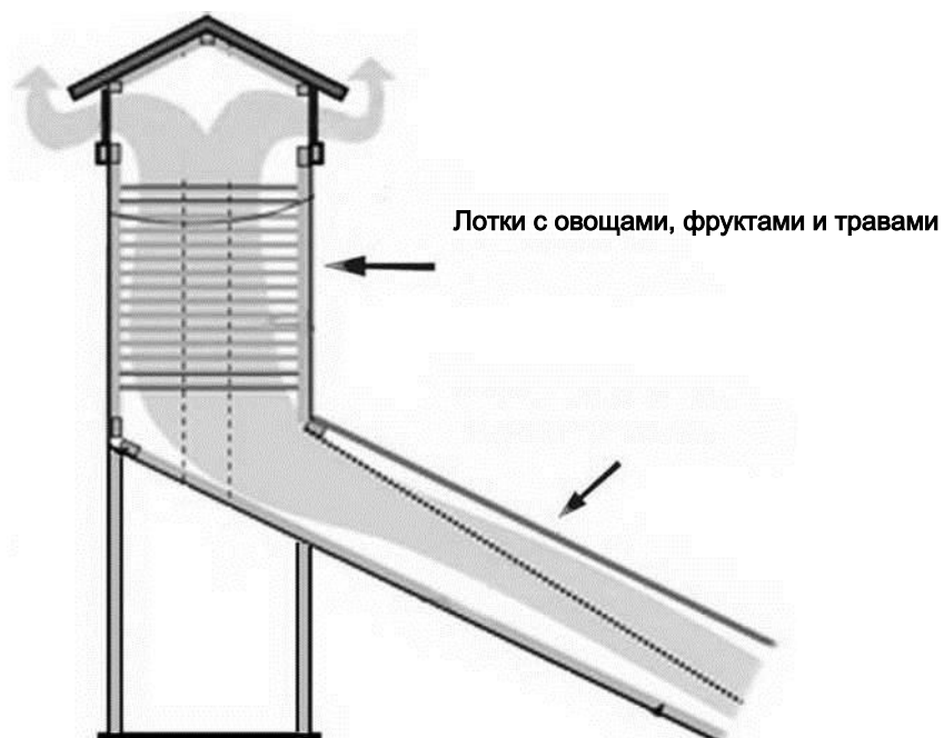
Схема действующей модели солнечной сушилки центра ОО «Белорусский зеленый крест».

Стекло, через которое нагревается воздух