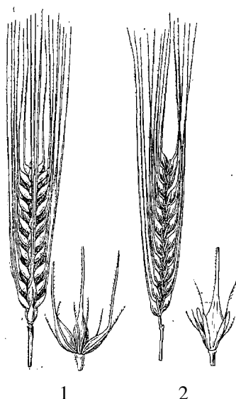
Рис. 1. Подвиды ячменя посевного: 1 – многорядный; 2 – двурядный

У двурядного ячменя H. sativum ssp. disticum L. на каждом уступе колосового стержня плодовитым колоском является только один средний, а боковые колоски остаются недоразвитыми (редуцированными). В результате этого с каждой стороны колосового стержня образуется по одному вертикальному ряду зерен, а всего на колосе два ряда.