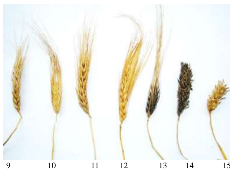
Рис. 3. Разновидности двурядного и многорядного ячменя: 1 – nutans ; 2 – deficiens ; 3 – erectum ; 4 – zeocritum ; 5 – medicum ; 6 – persicum ; 7 – nigricans ; 8 – manticum ; 9 – pallidum ; 10 – pyramidatum ; 11 – ricotense ; 12 – celeste ; 13 – nigrum ; 14 – nigrihorsfordianum ; 15 – horsfordianum