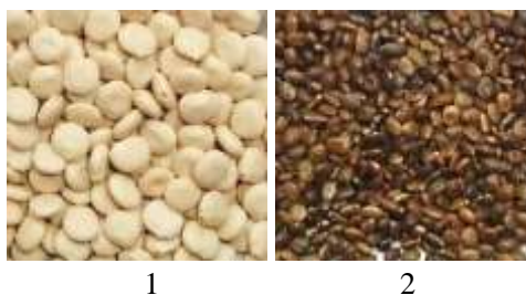
Рис. 3. Виды люпина: 1 – L. albus ; 2 – L. polyphyllus

Виды белого и многолетнего люпина представлены на рис. 3.