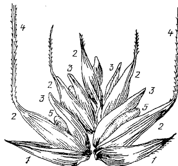
Рис. 2. Схема строения колоска пшеницы: 1 – колосковые чешуи; 2, 3 – наружные и внутренние цветковые чешуи; 4 – ости; 5 – зерно

ложным колоском). Масса 1000 семян колеблется от 20 до 50 г в зависимости от вида, сорта и условий выращивания.