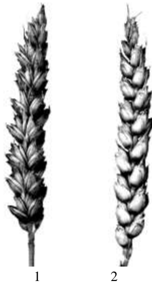
Рис. 1. Колос пшеницы:

Соцветие – сложный колос, состоит из расположенных на уступах колосового стержня колосков. На широкой, или лицевой, стороне колосового стержня колоски расположены в один ряд. С боковой стороны колоски чередуются слева и справа и образуют два ряда. Соотношение между лицевой и боковой сторонами у различных видов бывает неодинаковым (рис. 1).