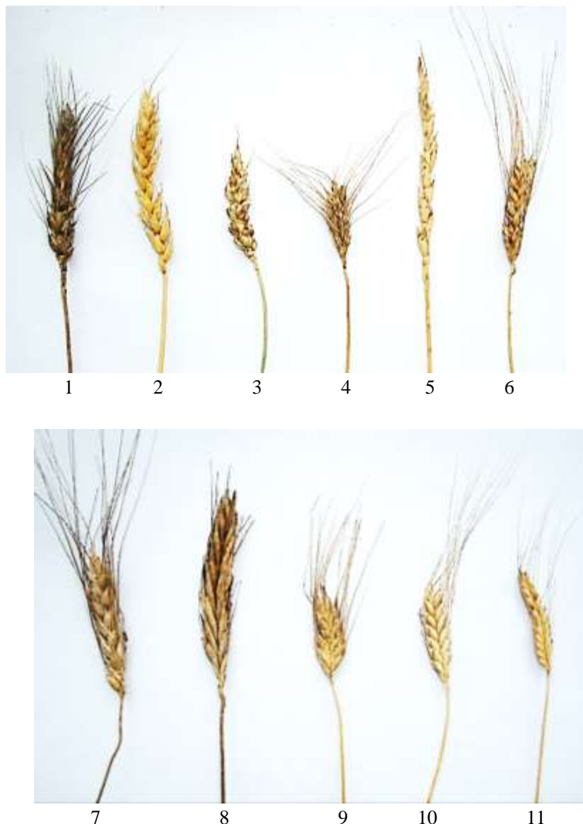
Рис. 4. Виды пшеницы: 1, 2 – T. aestivum ; 3 – T. sphaerococcum ; 4 – T. compactum ; 5 – T. spelta ; 6 – T. macha 7 – T. durum ; 8 – T. polonicum ; 9 – T. timopheevii ; 10 – T. dicoccum ; 11 – T. monococcum

Гербарный колосовой материал основных видов пшеницы приведен на рис. 4.