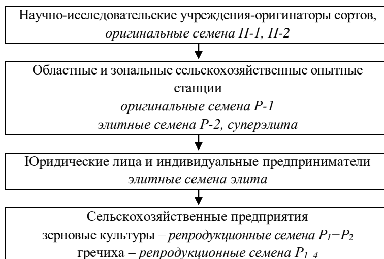
Рис. 3. Система семеноводства зерновых, зернобобовых и крупяных культур (2021 г.)

7 мая 2021 г. принят закон «О селекции и семеноводстве сельскохозяйственных растений», который вводит новые подходы к правовому регулированию деятельности в области создания сортов растений, применяемых в сельском хозяйстве; производства и использования их семян. Современная организация семеноводства в Республике Беларусь включает следующие подразделения (рис. 3):