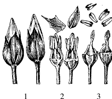
Рис. 2. Строение цветков льна:

Лен – растение самоопыляющееся. Еще накануне цветения можно определить, какие бутоны распустятся на следующий день: у таких бутонов над чашелистиками виден конус лепестков (рис. 2).