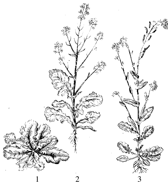
Рис. 3. Рапс озимый первого (1) и второго (2) года жизни и сурепица (3)

Рапс отличается от сурепицы по общему габитусу; окраске, строению, опушенности и характеру прикрепления листьев к стеблю; размеру и окраске цветков; форме соцветия; форме, размеру и характеру прикрепления стручков; окраске и размеру семян; форме и окраске семядолей и др. (рис. 3).