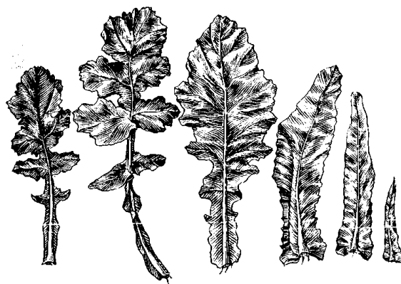
Рис. 1. Листья рапса

Листья очередные, черешковые, сизо-зеленые или фиолетовые, покрыты восковым налетом, неопушенные или слегка волосистые; нижние – лировидно-перистообразные с овальной или округлой тупой верхней долей, образуют компактную или слегка приподнятую над поверхностью почвы розетку; средние – удлиненно-копьевидные; верхние – цельные, удлиненно-ланцетные (рис. 1). Листья на 1/3–2/3 охватывают стебель.