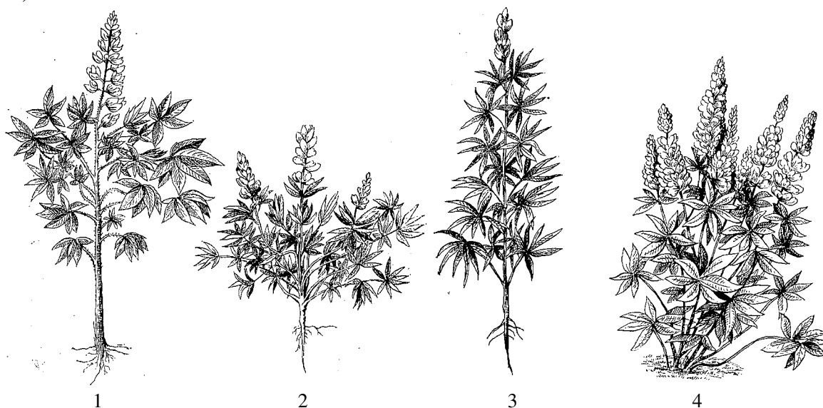
Рис. 2. Виды люпина:

средиземноморской принадлежат только 14 видов. Возделывается четыре вида люпина: белый, желтый, узколистный (средиземноморская группа) и многолетний (американская группа) (рис. 2).