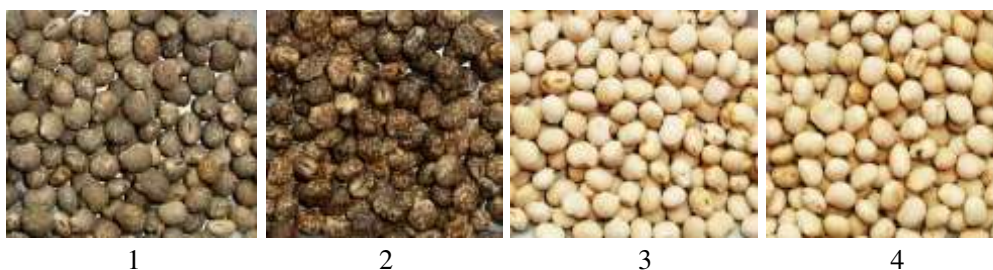
Рис. 5. Разновидности люпина узколистного: 1 – coeruleus ; 2 – roseus ; 3 – leucanthus ; 4 – albosyringeus