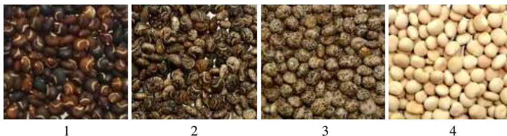
Рис. 4. Разновидности люпина желтого:

Основные разновидности желтого люпина представлены на рис. 4.