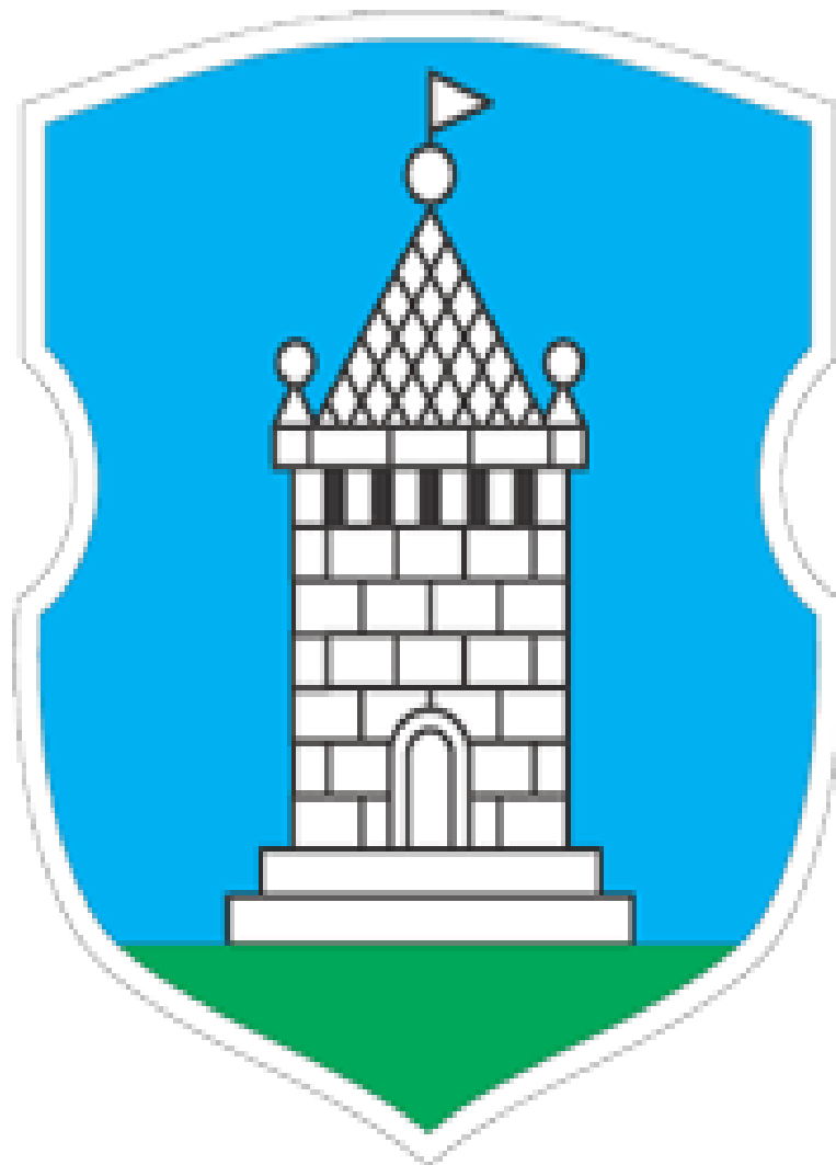
Герб Могилёва 1577 г.