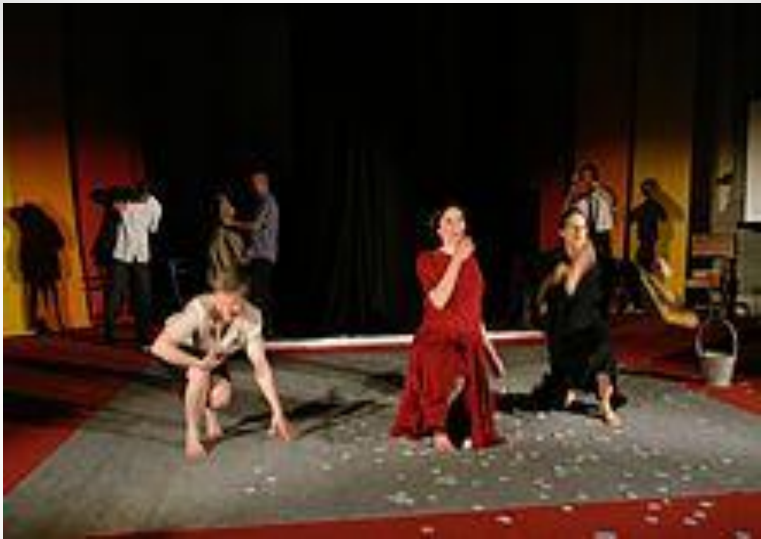
Спектакль по книге «Чернобыльская молитва», Женева, 2009