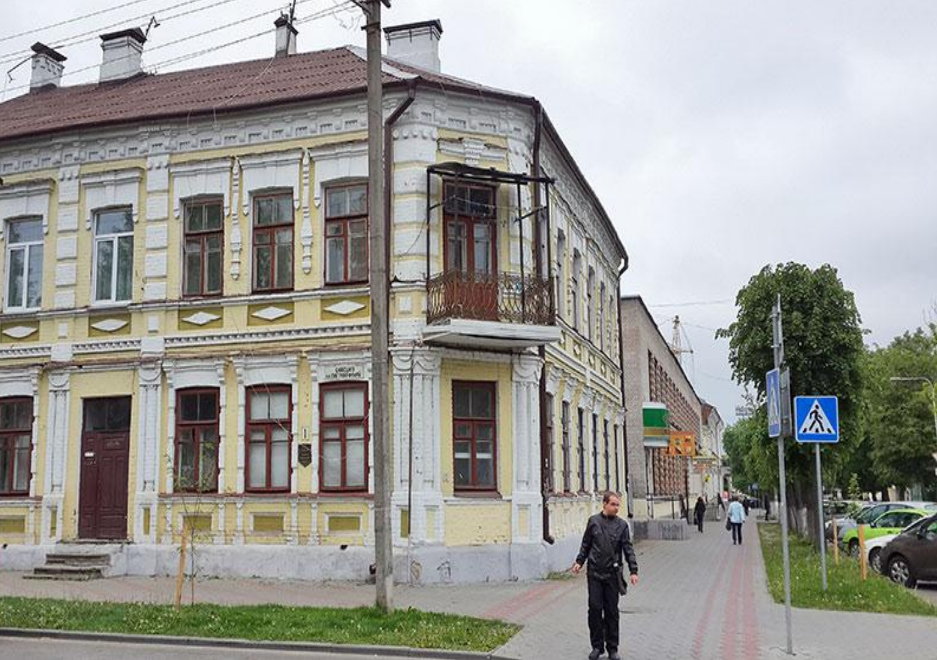
Дорога на ул. К. Маркса с ул. Советской