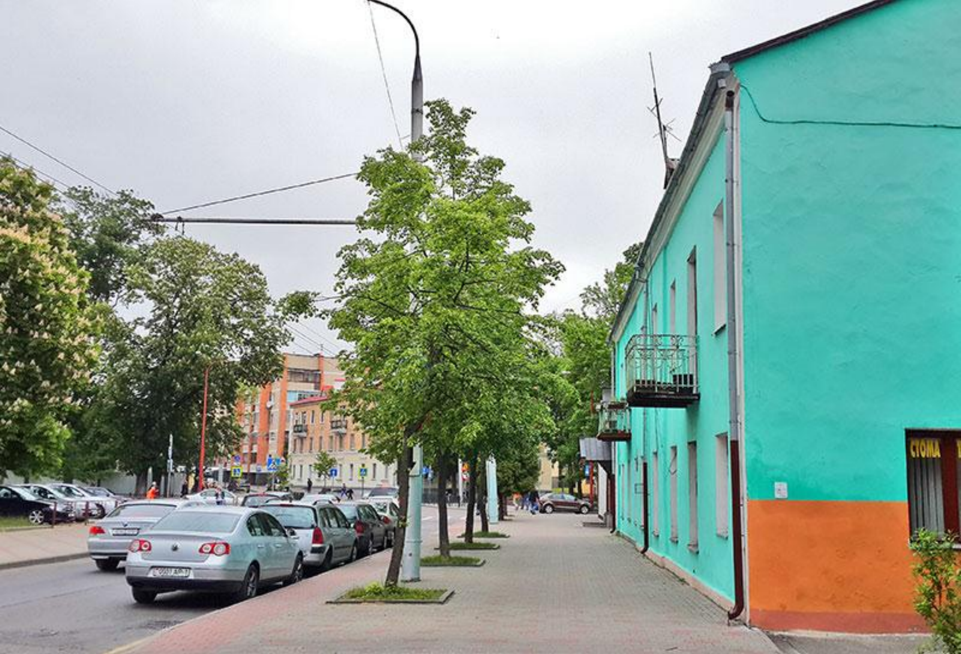
УЛИЦА КАРЛА МАРКСА