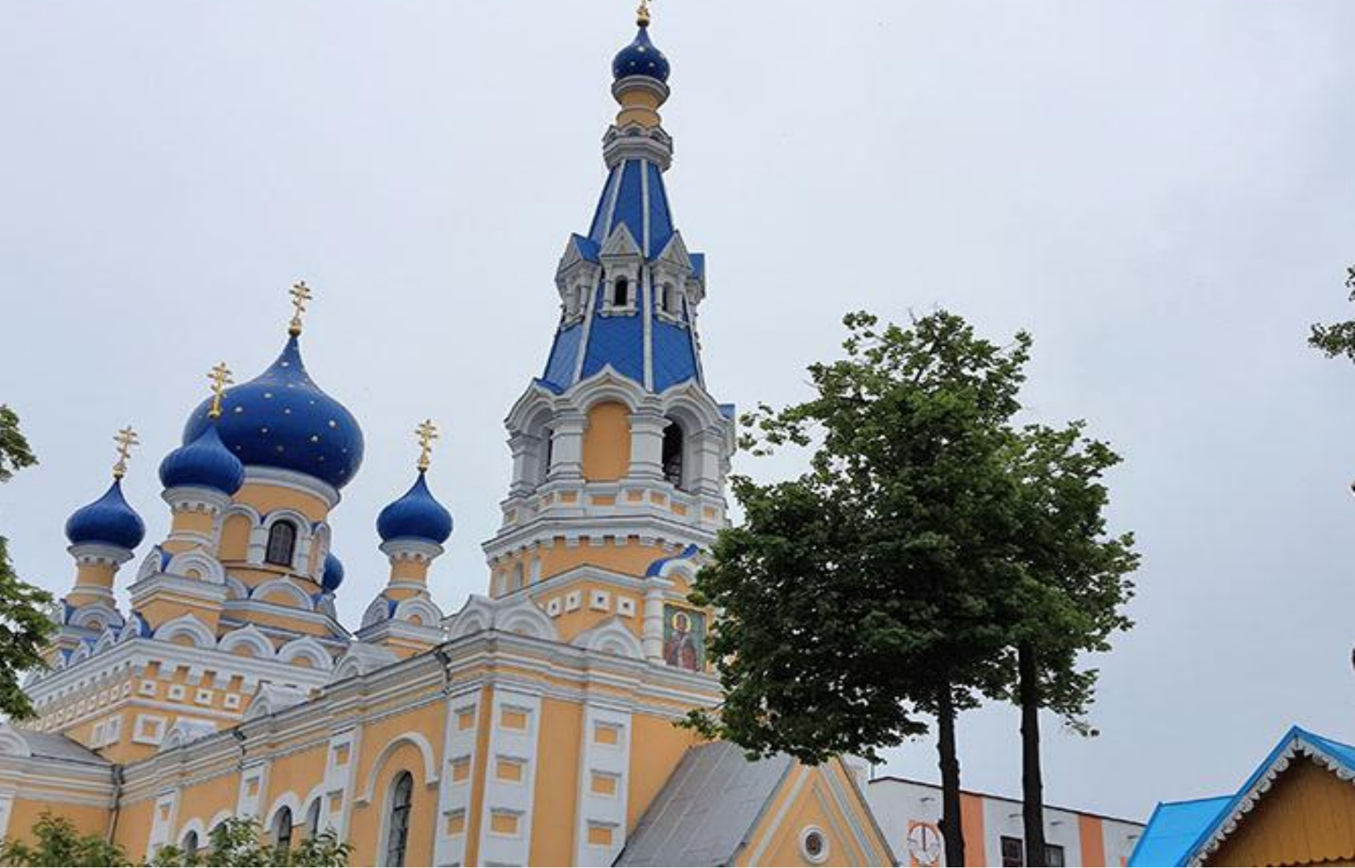
Брестская Свято-Николаевская братская церковь