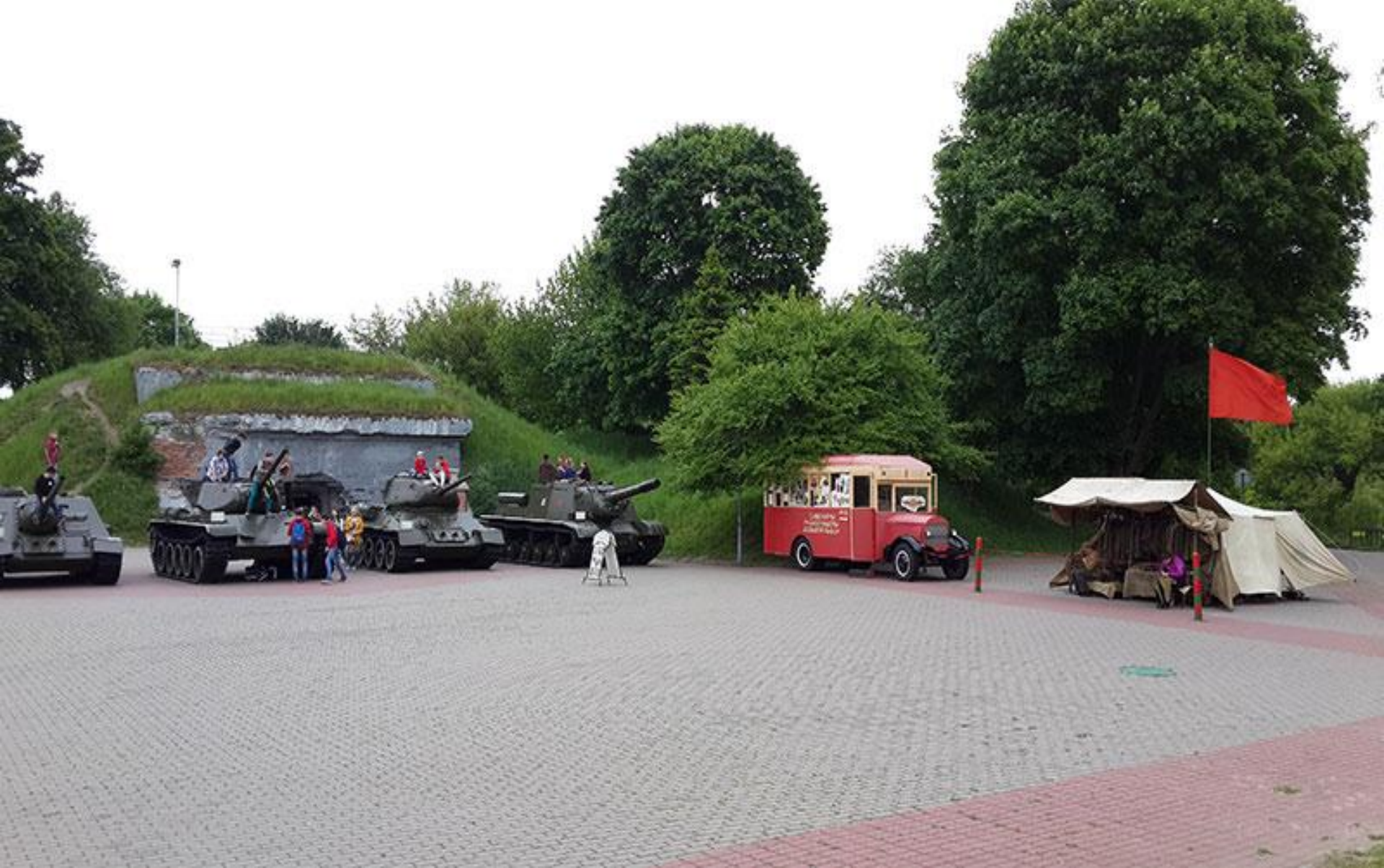
Танки и сувениры ручной работы