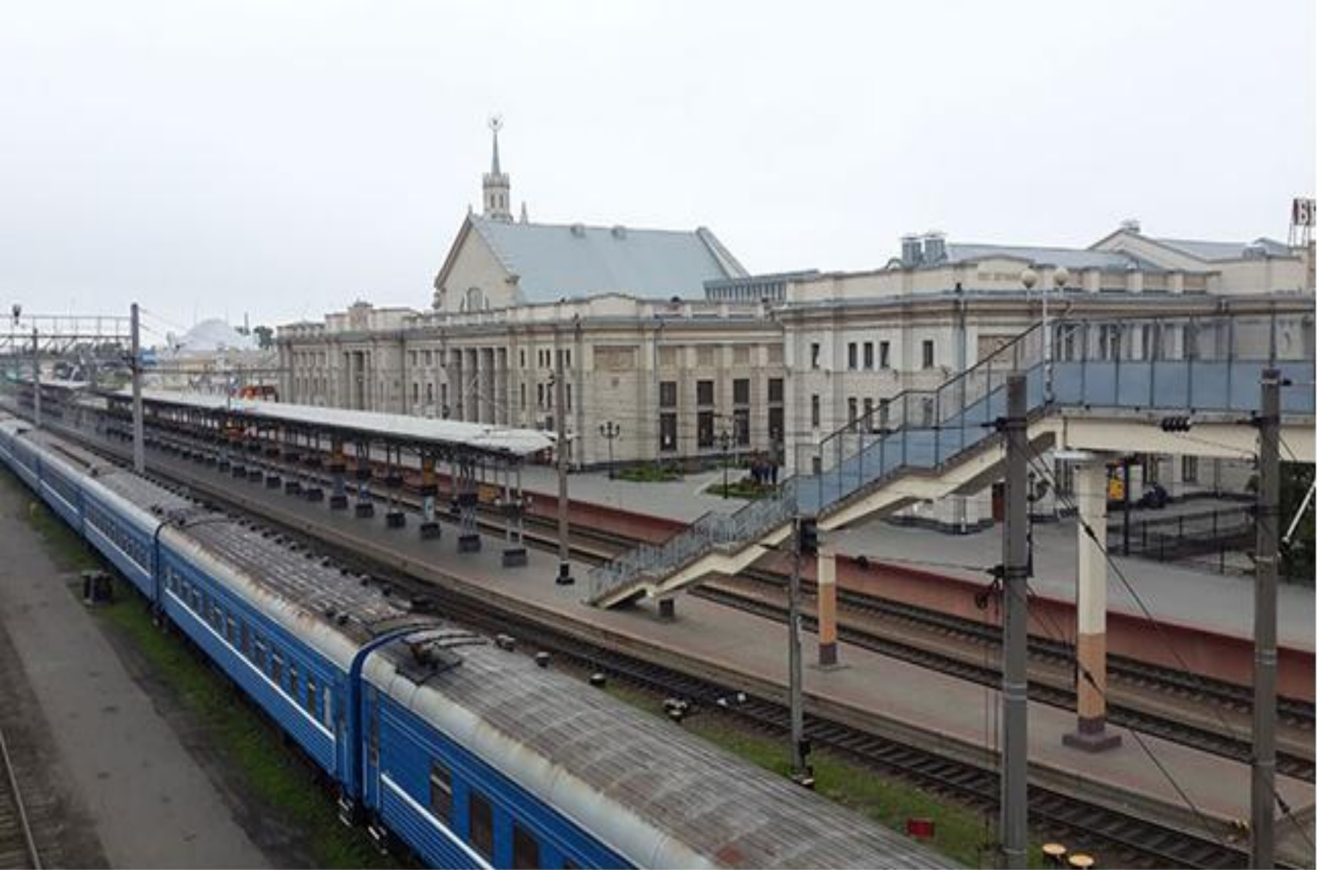
ЖЕЛЕЗНОДОРОЖНЫЙ ВОКЗАЛ В БРЕСТЕ