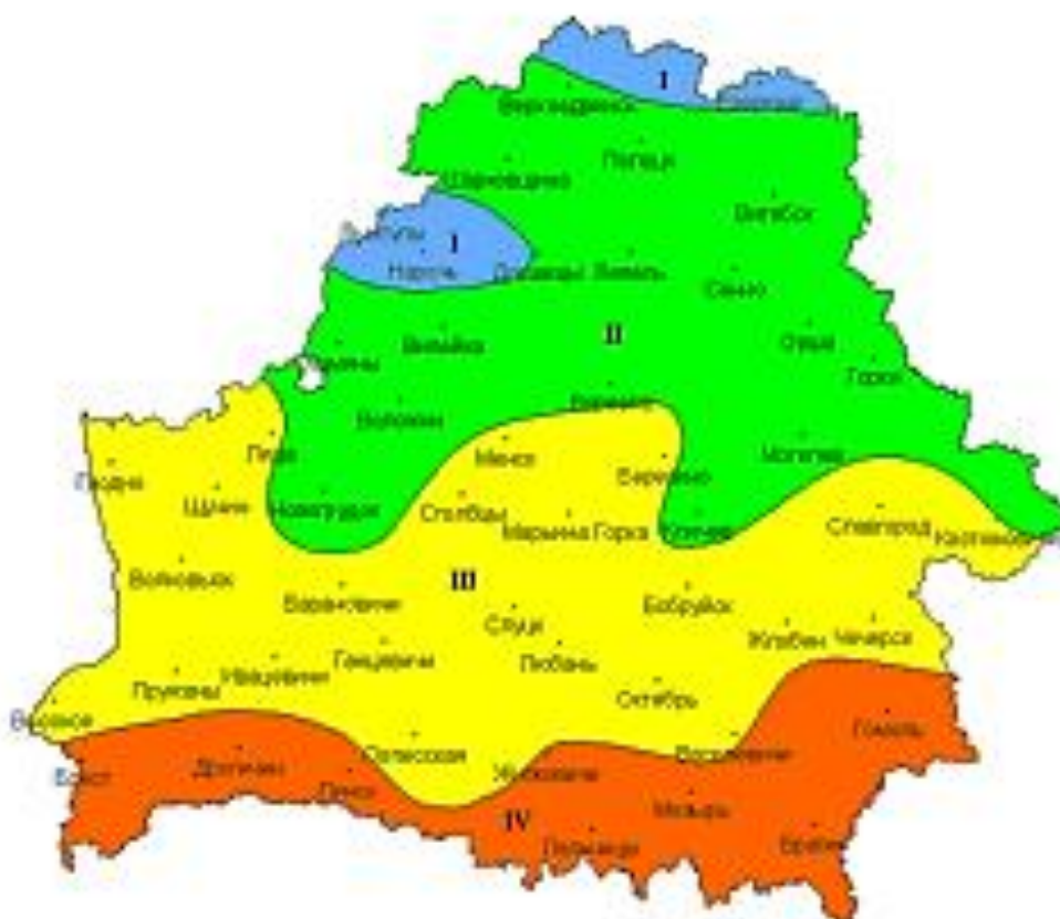
Сумма температур воздуха выше 10°C

Количественные характеристики факторов жизни растений в конкретных регионах различны. Согласно агроклиматическим зонам Беларуси климатические зоны различаются по ряду показателей: количеством тепла и влаги в вегетационный период, условиями перезимовки сельскохозяйственных культур и др.