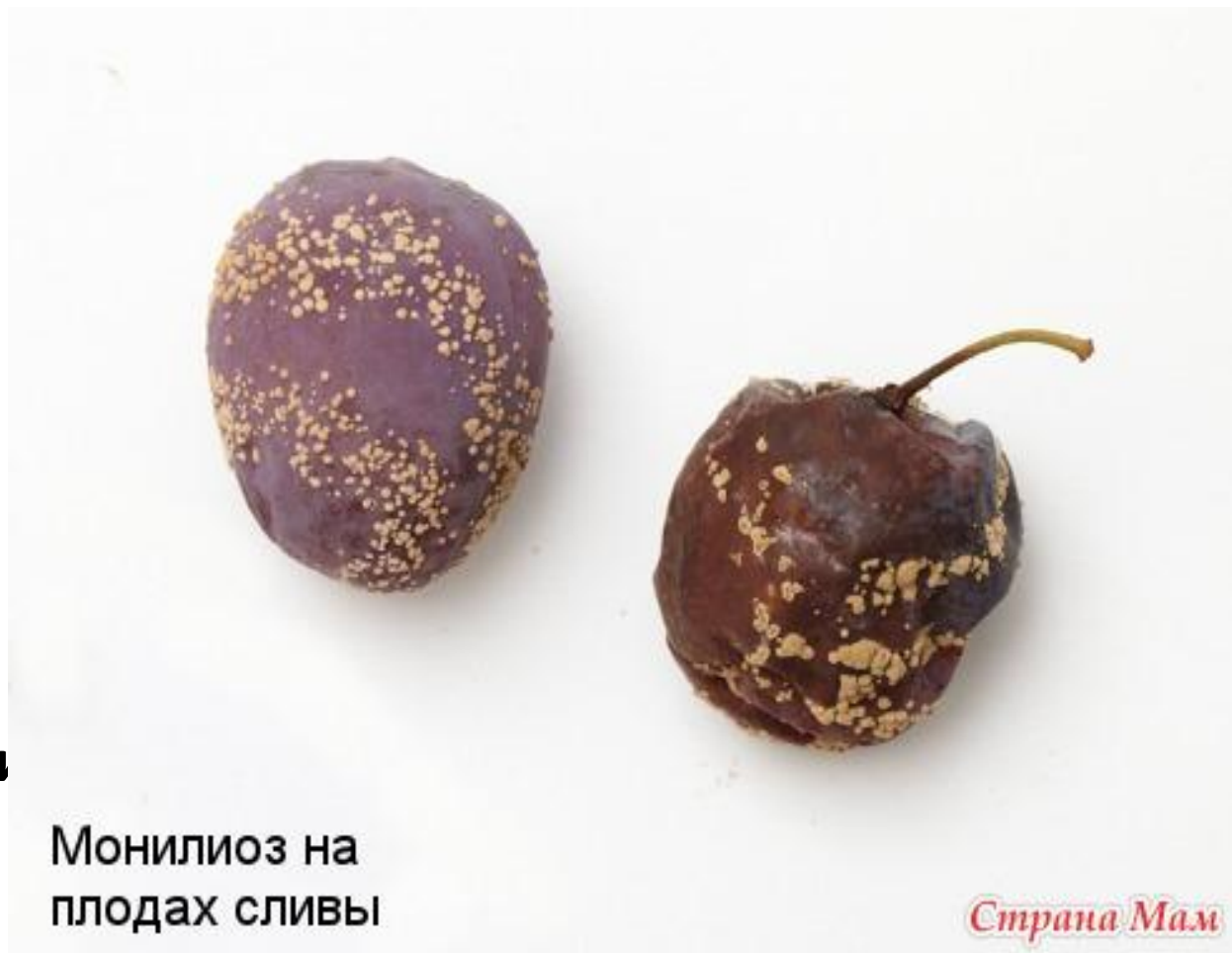
Монилиоз на плодах сливы

– опрыскивание инсектицидами в последний день цветения.