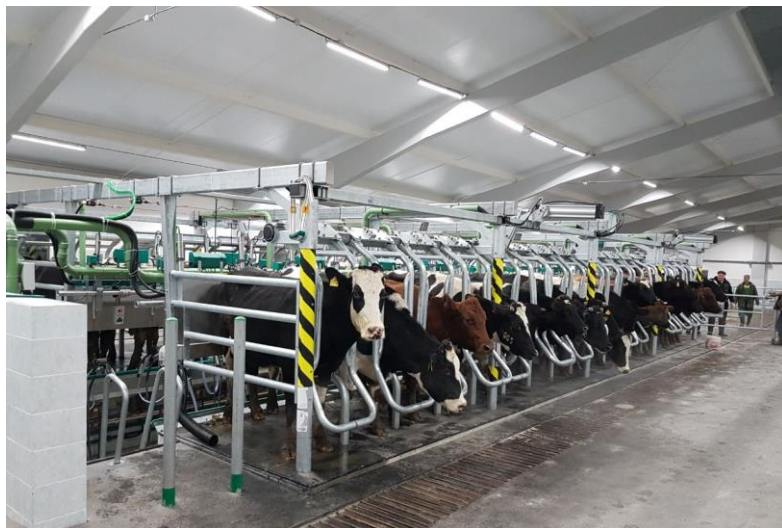
Рисунок ..... – Доильный зал «Параллель»

В классическом доильном зале «Параллель» каждое доильное место оборудовано доильным аппаратом. Этот вариант идеально подходит для хозяйств, где есть необходимость оптимизировать рабочее пространство или где дойка коров производится по группам.