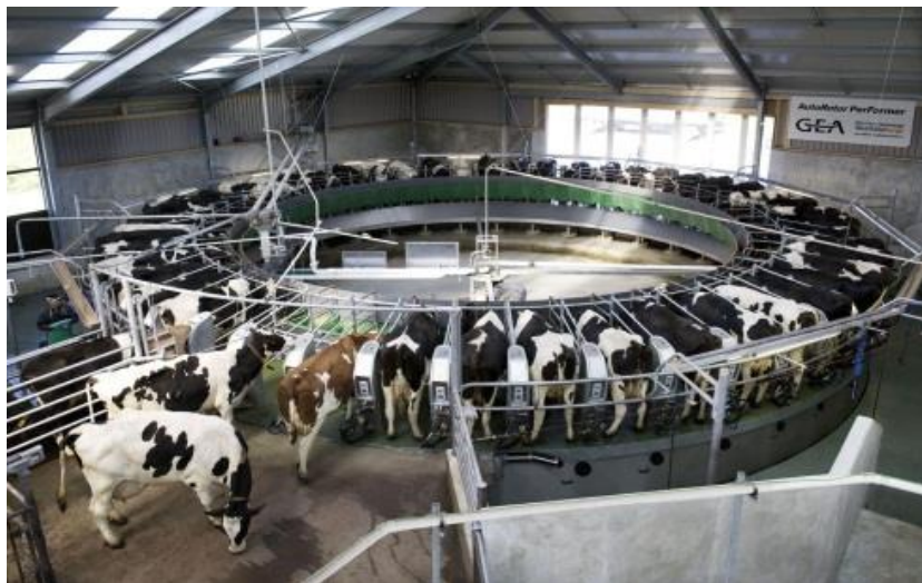
Рисунок .... – Доильный зал «Карусель»

Принципиальное отличие доильных залов «Карусель» от всех, использовавшихся ранее, – уменьшенный до нуля фронт доения: животные подъезжают к оператору на медленно вращающейся платформе, оператор обрабатывает вымя и подключает доильные аппараты, оставаясь на своем месте, что сводит трудозатраты до минимума. Благодаря использованию множества уникальных технологических решений, эти залы обеспечивают оптимальное равновесие в системе «человек – корова – молоко», влияя на все ее составляющие: эргономику работы персонала, здоровье животных, количество и качество получаемой продукции.