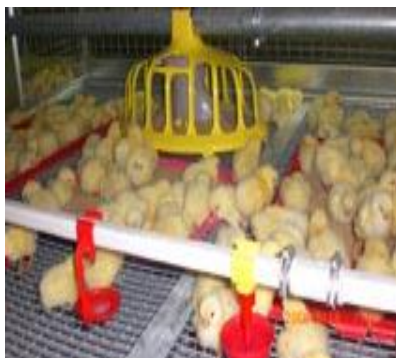
Рисунок .... – Напольное и клеточное содержание бройлеров

Бройлеров в основном выращивают на глубокой подстилке и в клеточных батареях (рисунок ....).