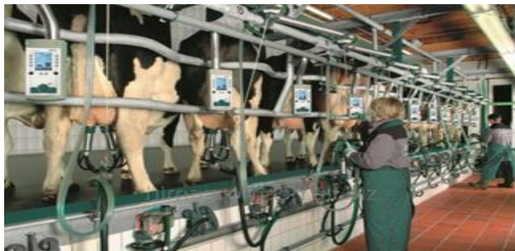
Рисунок .... – Доильный зал «Ёлочка»

электронная система пульсации, центробежный молочный насос и молокоприемник, транспортная молочная линия, оборудованная кронштейном из нержавеющей стали для подключения к танку для охлаждения молока. В доильном зале «Ёлочка» коровы могут размещаться под углом от 30 до 90 градусов.