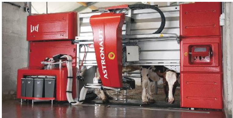
Рисунок ..... – Молочный робот «ASTRONAUT А3»

По заключениям зооветеринарных специалистов увеличение числа доек с одновременной подкормкой концентрированными кормами улучшает физиологическое состояние дойных коров, повышает усвояемость корма, стимулирует молокообразование, способствует развитию здорового вымени, снижает опасность возникновения мастита, а метод добровольного самообслуживания коров позволяет исключить у них стрессы. Индивидуальный принцип обслуживания и благоприятное воздействие полной автоматизации кормления и доения на продуктивность и здоровье коров делают вполне реальным увеличение продолжительности хозяйственного их использования с нынешних 3-4 до 6 лактаций и более.