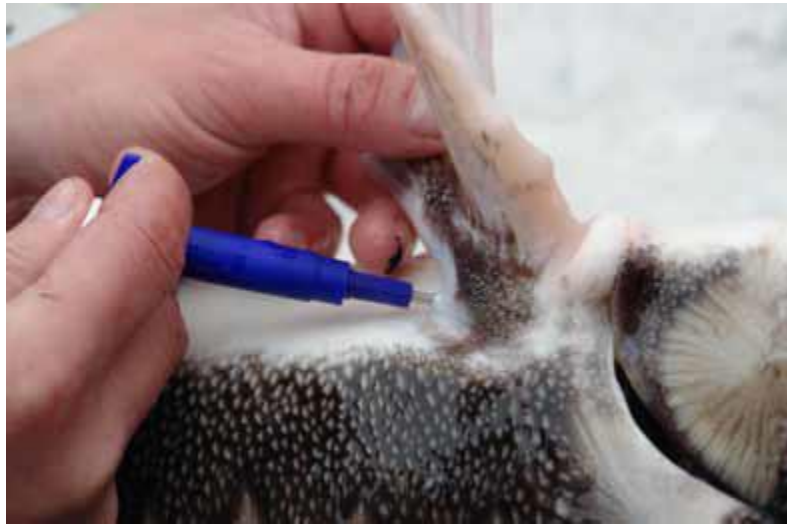
Рисунок 3. Мечение самки азовской севрюги ПИТ-меткой