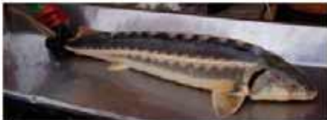
Персональный набор аллелей четырех микросателлитных локусов

Южный филиал ФГУП "Федеральный селекционно-генетический центр рыболовства" Индивидуальный молекулярно-генетический паспорт выдан Центром молекулярно-генетической идентификации Русский осотр (L. reibickii), самка GUE2642 (IV стадия зрелости) Проба отобрана и фото сделано в ноябре 2006 г. при биометрии зимнего стада ЮФ ФСТПР Псков, Чита, Республика Алтай, МУП "Живой рыб". Образец запечатан в Российскую национальную коллекцию молекулярно-генетической идентификации (РНКЗМ)