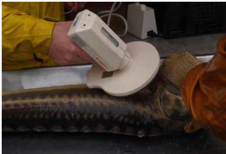
Рисунок 4. Портативный ручной детектор (ридер) для считывания ПИТ-меток

Кроме вышеперечисленных способов мечения, при работе с производителями в период подготовки и проведения нерестовой компании эффективно использование временных меток, надеваемых на хвостовой стебель рыб (Conte et al. , 1988). В некоторых случаях для облегчения идентификации рыб, помеченных ПИТ-метками, целесообразно дополнительно пометить их визуальную различимой меткой. Визуальные имплантируемые эластомеры (VIE) имплантируются в нижнюю часть рыла с использованием различных цветов и ориентации на теле ( www.nmt-inc.com ). Данные метки вводятся в жидком виде и достаточно быстро затвердевают.