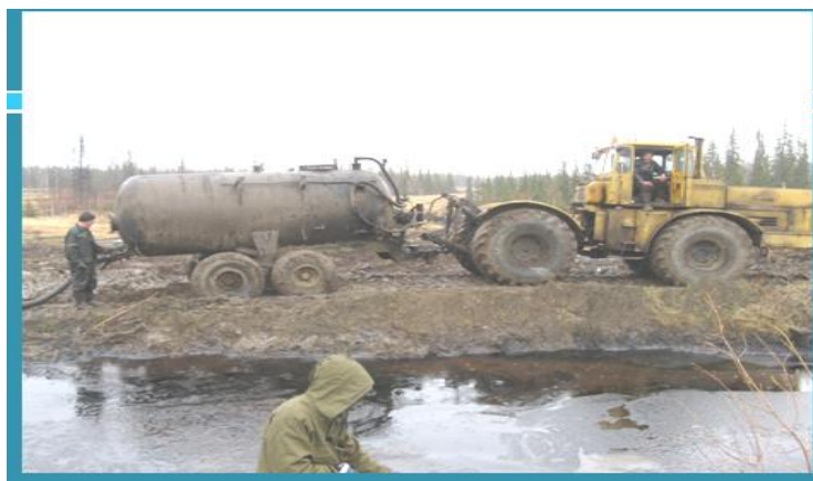
Рис. 14.1. Рекультивация земель, загрязненных нефтью и нефтепродуктами

Для земель сельскохозяйственного назначения принято следующее содержание их в почве, мг/кг: