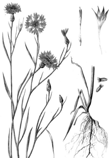
Рис. 1. – Внешний вид растения василька синего

Василек синий – однолетнее или двулетнее травянистое растение семейства Астровые ( Asteraceae ) (рис. 1). Растение ядовитое.