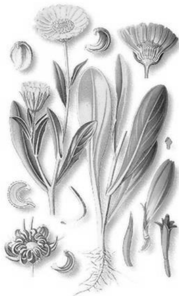
Рис. 2. – Внешний вид растения календулы лекарственной

срединные – трубчатые. Плод – согнутая семянка без хохолка; наружная поверхность покрыта бугорками и острыми шипиками.