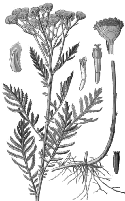
Рис. 3. – Внешний вид растения пижмы обыкновенной

Химический состав. Цветки содержат жирное и эфирное масло (до 3%), алкалоиды (до 0,5%), дубильные вещества, горькое вещество танацетин, флавоноиды, танацетовую, галлусовую, кофейную и хлорогеновую кислоты; смолу, сахар, камедь, красящие и экстрактивные вещества.