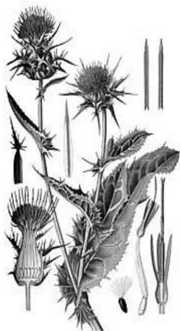
Рис. 4. – Внешний вид растения расторопши пятнистой

Расторопша пятнистая, или чертополох молочный, – однолетнее травянистое растение семейства Астровые (Asteraceae) (рис. 4).