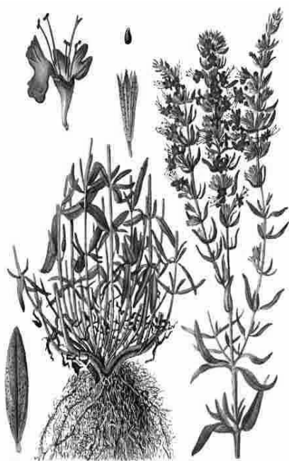
Рис. 3. Внешний вид растения иссопа лекарственного

Биологические особенности. Отличается медленным ростом на ранних стадиях развития. Всходы появляются через 10–14 дней. Цветет со второго года жизни, с конца июня по август. При возделывании рассадой растения зацветают в первый год. Семена созревают в сентябре.