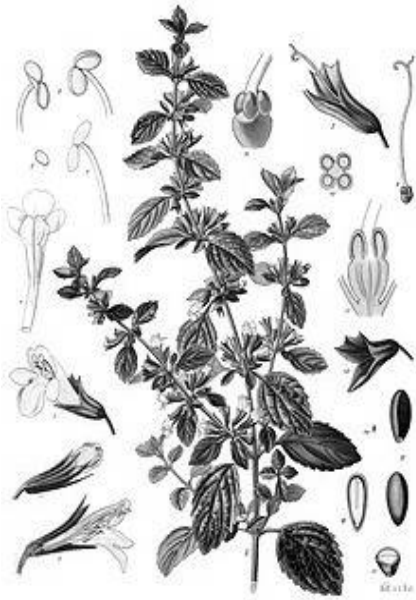
Рис. 7. Внешний вид растения мелиссы лекарственной

Ботаническая характеристика. Высота растения 40–80 см. Корневище сильно ветвящееся подземное. Стебли прямостоячие, ветвистые, опушенные. Листья овальные, супротивные, городчатые.