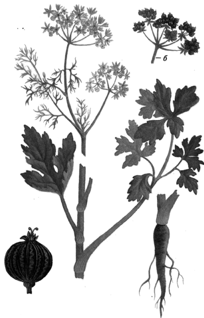
Рис. 4. Внешний вид растения кориандра обыкновенного

Кориандр обыкновенный – однолетнее травянистое растение семейства Сельдерейные ( Apiaceae ) (рис. 4).