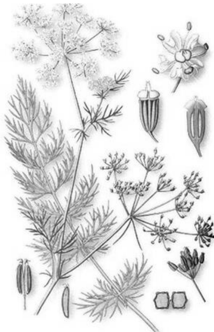
Рис. 12. Внешний вид растения тмина обыкновенного

Тмин обыкновенный – двулетнее травянистое растение семейства Сельдереиные ( Ariaceae ) (рис. 12).