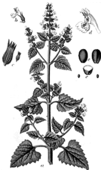
Рис. 5. Внешний вид растения котовника кошачьего

Химический состав. Трава содержит эфирное масло (до 0,6 %), гликозиды, танины, сапонины, фитонциды, аскорбиновую кислоту. В состав эфирного масла входят карвакрол, пулегон. В семенах содержится до 26,5 % жирного масла.