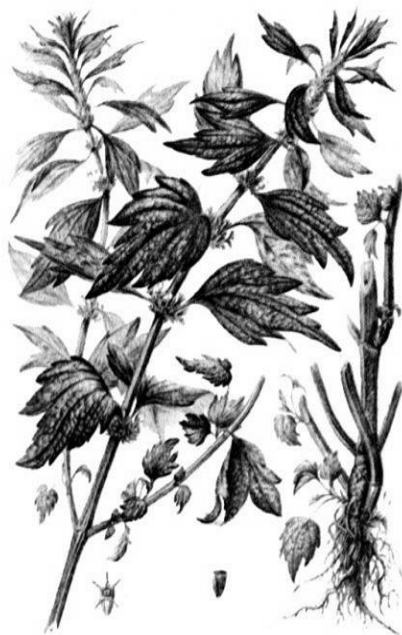
Рис. 10. Внешний вид растения пустырника сердечного

Пустырник сердечный – многолетнее травянистое растение семейства Яснотковые ( Lamiaceae ) (рис. 10).