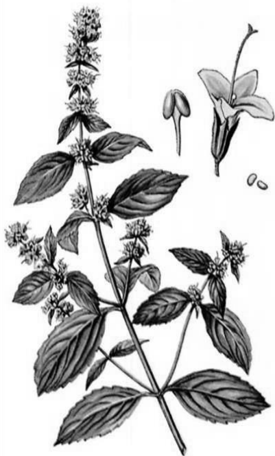
Рис. 9. Внешний вид растения мяты перечной

узлов. Наряду с прямостоячими стеблями развиваются стелющиеся подземные или надземные плети.