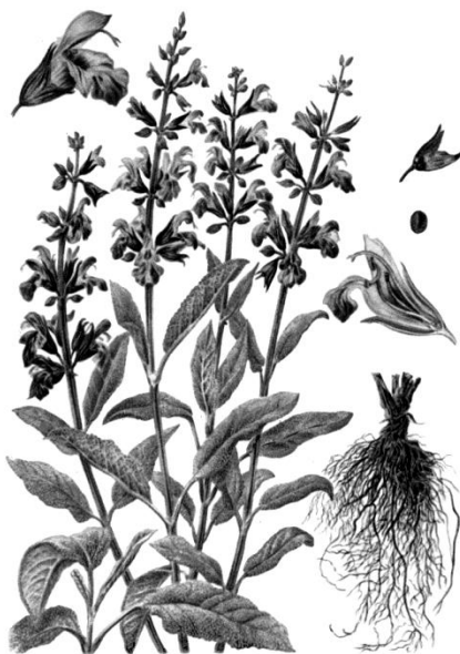
Рис. 13. Внешний вид растения шалфея лекарственного

Ботаническая характеристика. Растение высотой до 75 см. Корень мощный, деревянистый. Стебель ветвистый, внизу одревесневающий, вверху травянистый, в первый год жизни четырехгранный, войлочно-опушенный. Развивает в хороших условиях до 100 и более побегов.