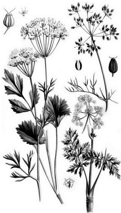
Рис. 1. Внешний вид растения аниса обыкновенного

Плод – яйцевидная двусемянка, заостренная наверху, со слабым опушением, зеленовато-серая или серовато-коричневая. Каждый полуплодик имеет 5 тонких ребер, между которыми расположено 15 мелких канальцев, содержащих эфирное масло. В полуплодике находится одно семя. Через 5 лет хранения семена теряют жизнеспособность. Масса 1000 семян 2–4 г.