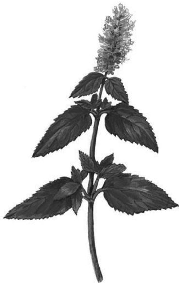
Рис. 8. Внешний вид растения многоколосника морщинистого