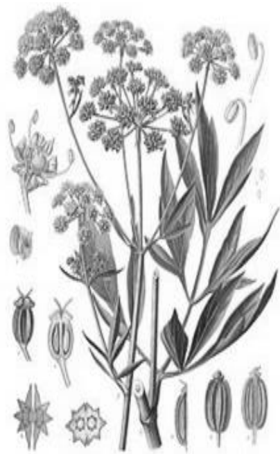
Рис. 6. Внешний вид растения любистока лекарственного

Плоды – эллиптические двусемянки, сжатые со спинки, распадаются на два желто-бурых полуплодика. Семена эллиптические, 5–7 мм длиной, желтовато-коричневые. Масса 1000 семян 2,5–4,0 г.