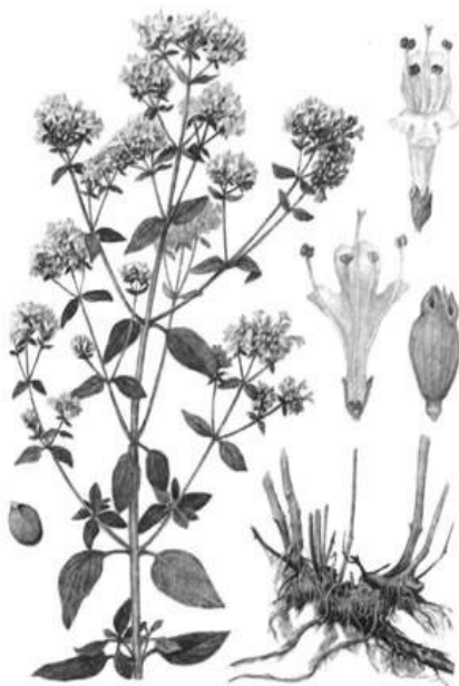
Рис. 2. Внешний вид растения душицы обыкновенной

тивныe, продолговато-яйцевидные. Цветки обоеполюе, лилово-розовые, реже белые, мелкие, многочисленныe, собраны в раскидистую щитковидную метелку. Плод состоит из четырех орешков. Орешки мелкие (до 1 мм), округлые, коричневые или коричнево-черные, гладкие матовые. Масса 1000 семян 0,2–0,3 г. Плоды сохраняют всхожесть 7–8 лет.