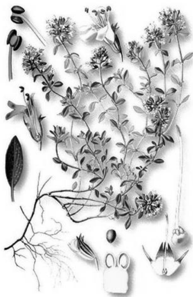
Рис. 11. Внешний вид растения тимьяна ползучего

Тимьян ползучий – многолетний ползучий полукустарник семейства Яснотковые ( Lamiaceae ) (рис. 11).