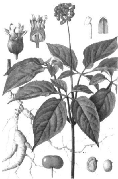
Рис. 4. Внешний вид растения женьшеня обыкновенного

Женьшень обыкновенный – многолетнее травянистое растение семейства Аралиевые ( Araliaceae ) (рис. 4).