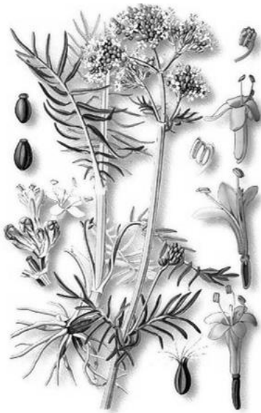
Рис. 2. Внешний вид растения валерианы лекарственной

лей. Цветки мелкие, душистые, обоеполые, собраны в крупное щитковидное соцветие; расположены полузонтиками на верхушках стебля и боковых побегов; венчик воронковидный, длиной 4–5 мм, белый, бледно-розовый или бледно-фиолетовый.