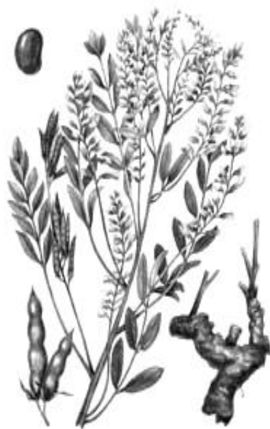
Рис. 8. Внешний вид растения солодки голой

Требования к качеству. Сухое сырье снаружи серовато-желтое, внутри светло-желтое, волокнистое, на вкус приторно-сладкое, без запаха. Влажность – не более 14 %. Содержание золы – 6–8 %. Органические и минеральные примеси – 0,5 % в очищенном сырье, 1,0 % в неочищенном. Части растений, утративших естественную окраску, – не более 4 % в неочищенном сырье.