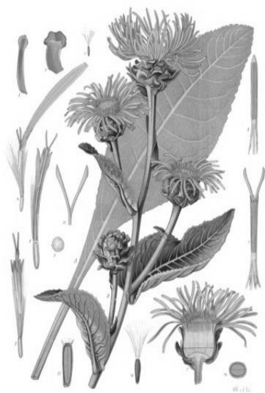
Рис. 3. Внешний вид растения девясила высокого

Химический состав. В состав корней и корневищ девясила входят полисахариды инулин (44 %), псевдоинулин и инуленин, эфирное масло (1–3 %), алкалоиды, сапонины, слизь, а также смесь сесквитерпеновых лактонов: алантолактона, изоалантолактона, дигидроалантолактона; витамин Е, смолы, камеди, пигменты, пектины, воск, стигмастерин, микроэлементы и другие химические соединения. В листьях присутствует горькое вещество – алантопикрин. В траве содержатся витамины С и Е, каротин, эфирное масло (3 %). В состав эфирного масла входят геленин, алантол и прозулен. В семенах накапливается до 22,3 % эфирного масла.