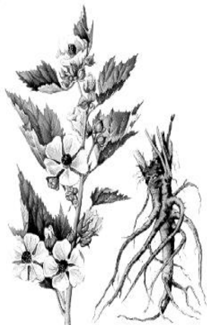
Рис. 1. Внешний вид растения алтея лекарственного

Алтей лекарственный – многолетнее травянистое растение семейства Мальвовые (Malvaceae) (рис. 1).