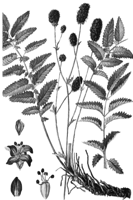
Рис. 5. Внешний вид растения кровохлебки лекарственной

цветия, сидящие на длинных цветоносах на концах ветвей. Плод – сухой односемянный орешек коричневого цвета.