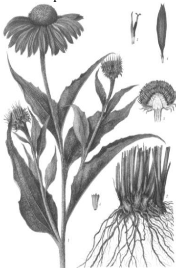
Рис. 9. Внешний вид растения эхинацеи пурпурной

Эхинацея пурпурная, или рудбекия пурпурная, – многолетнее травянистое растение семейства Астровые ( Asteraceae ) (рис. 9).