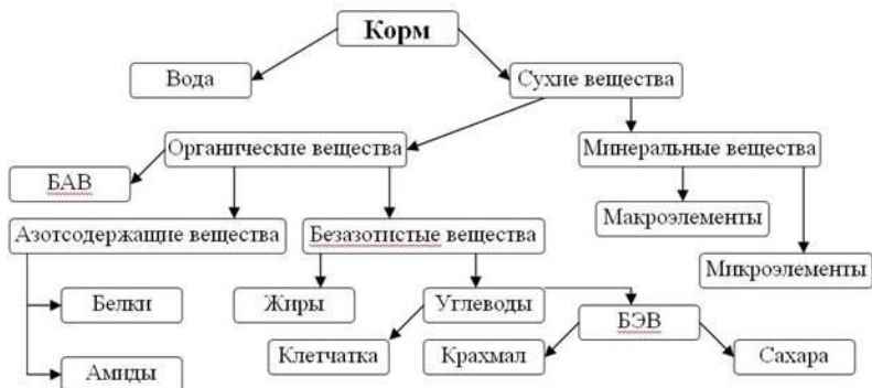
Рис 1. Классическая схема зоотехнического анализа кормов

Схему зооанализа можно представить в математическом виде. Для этого следует использовать следующие уравнения: