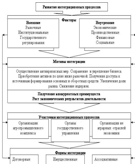
Рис. 8.2. Модель развития интеграционных процессов

Первый – макроэкономический уровень, предполагающий разработку нормативно-правовой базы развития интеграционных процессов и согласование развития всех сфер экономики.