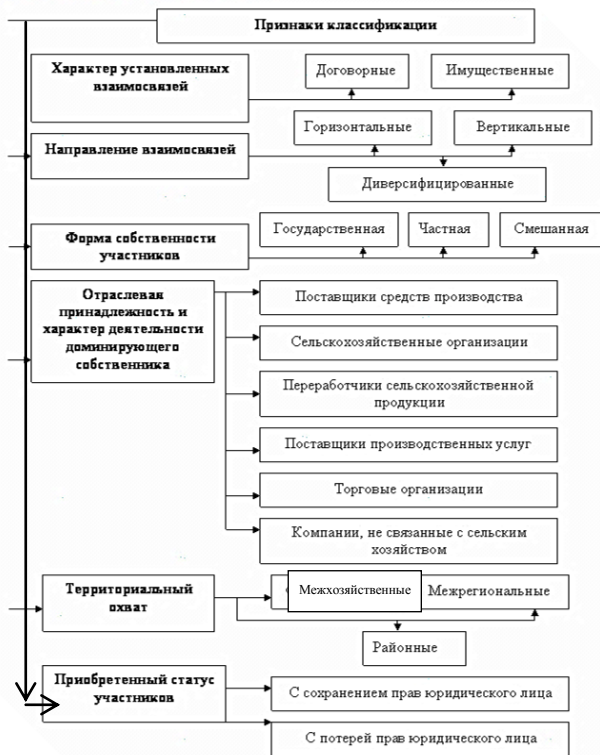
Рис. 8.4. Классификация интегрированных агропромышленных объединений

Как свидетельствует практика, создание нового формирования всегда порождает проблему контроля над ним. Различные варианты решения этой проблемы лежат в основе выбора его внутренней организационной структуры. Организационная структура агропромышленного интеграционного формирования представляет собой совокупность предприятий-участников и их иерархическое положение в объединении.