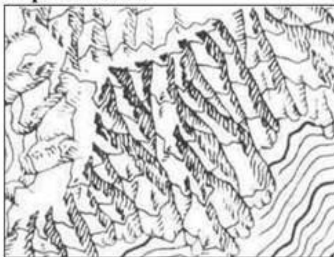
в) Теневая штриховка