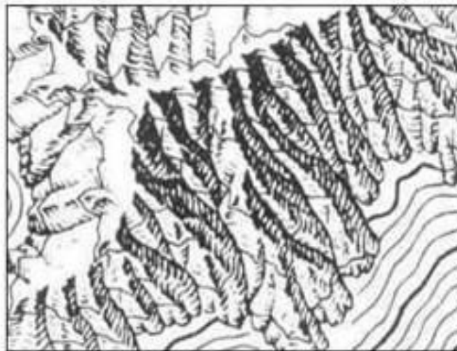
г) Завершающая проработка рисунка с учетом воздушной перспективы