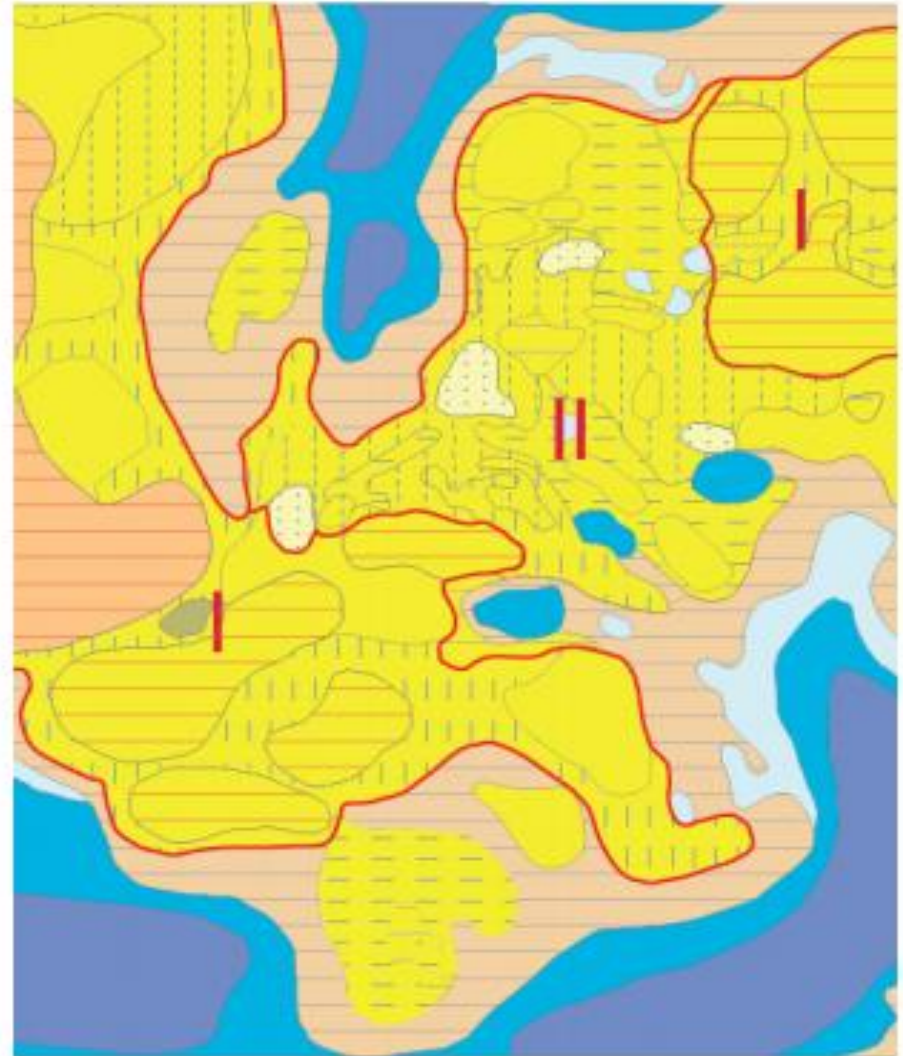
Рисунок 3.2. – Почвенная карта ключевого участка «Светлогорский» (масштаб 1 : 10 000)