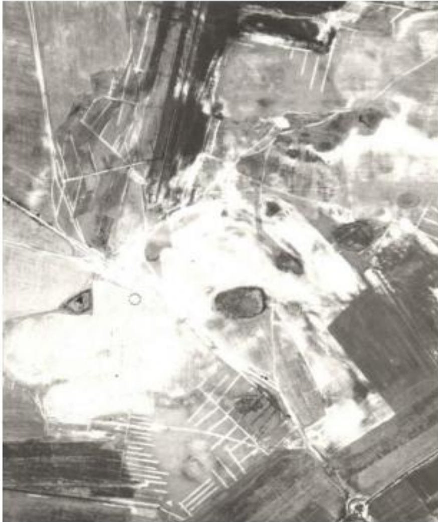
Рисунок 3.1. – Спектральный аэрофотоснимок ключевого участка «Светлогорский»