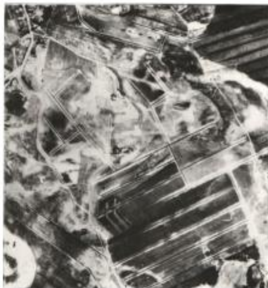
Рисунок 3.24. – Панхроматический аэрофотоснимок ключевого участка «Повитье»