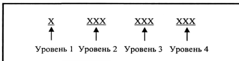
Рис. 2.1. Структура кода СОАТО

Объектами классификации в СОАТО являются: области, г. Минск (уровень 1); районы области, внутригородские районы г. Минска, города областного подчинения (уровень 2); города районного подчинения, поселки городского типа, сельские Советы (уровень 3); сельские населенные пункты (уровень 4). На рис. 2.1 представлена структура кода СОАТО.