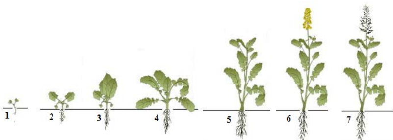
Рис. 5. Фазы развития рапса: 1 – всходы; 2–4 – формирование розетки (2 – два настоящих листа, 3 – четыре настоящих листа, 4 – шесть настоящих листьев); 5 – стеблевание; 6 – бутонизация и цветение; 7 – созревание