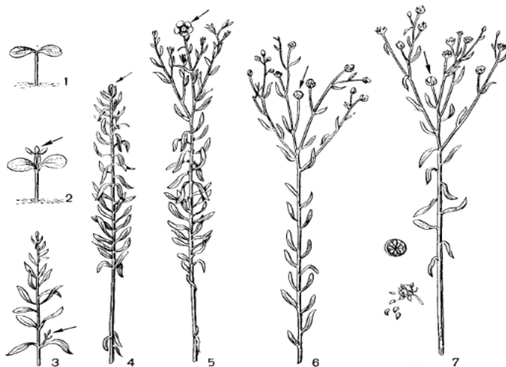
Рис. 3. Фазы развития льна:

1 – всходы; 2 – образование настоящих листьев; 3 – «елочка»; 4 – интенсивный рост – бутонизация; 5 – цветение; 6 – созревание