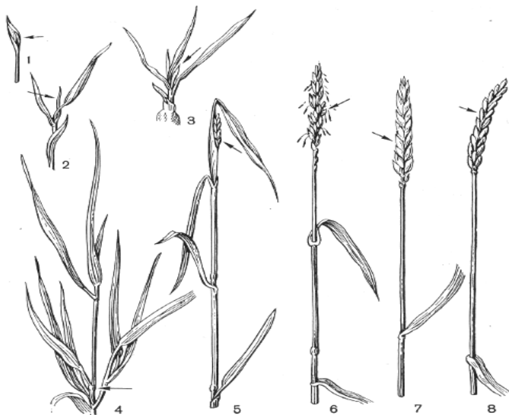
Рис. 2. Фазы развития злаковых культур:

У злаковых культур фиксируют наступление следующих фаз развития (рис. 2).