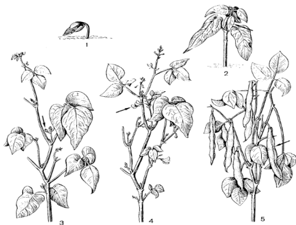
Рис. 4. Фазы развития зернобобовых культур: 1 – всходы; 2 – второй настоящий лист; 3 – бутонизация; 4 – цветение; 5 – созревание

У зернобобовых культур и рапса, как у многих двудольных растений, различают следующие фазы: всходы, появление настоящих листьев, бутонизация, цветение и созревание (рис. 4–5, табл. 10–11).