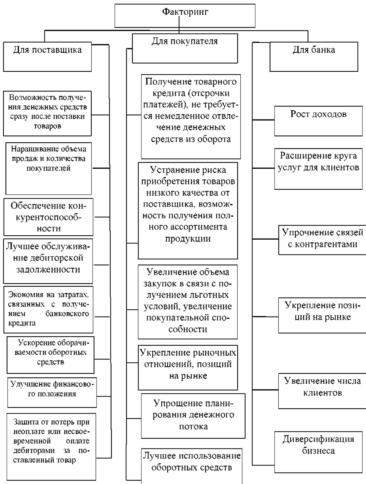
Рис. 8.1. Эффективность факторинга для его участников