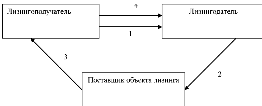
Рис. 8.2. Последовательность лизинговых операций

Примерная последовательность лизинговых операций представлена на рис. 1.