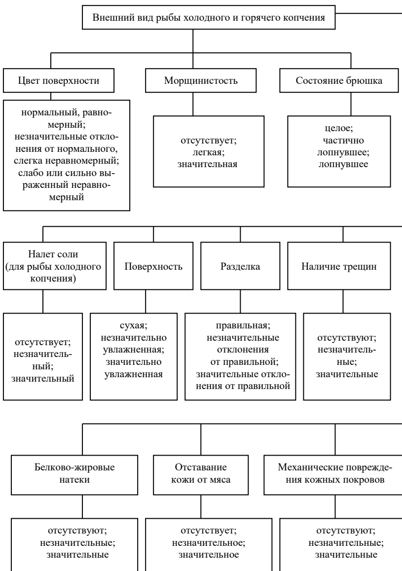
Рис. 4. Оценка внешнего вида рыбы холодного и горячего копчения