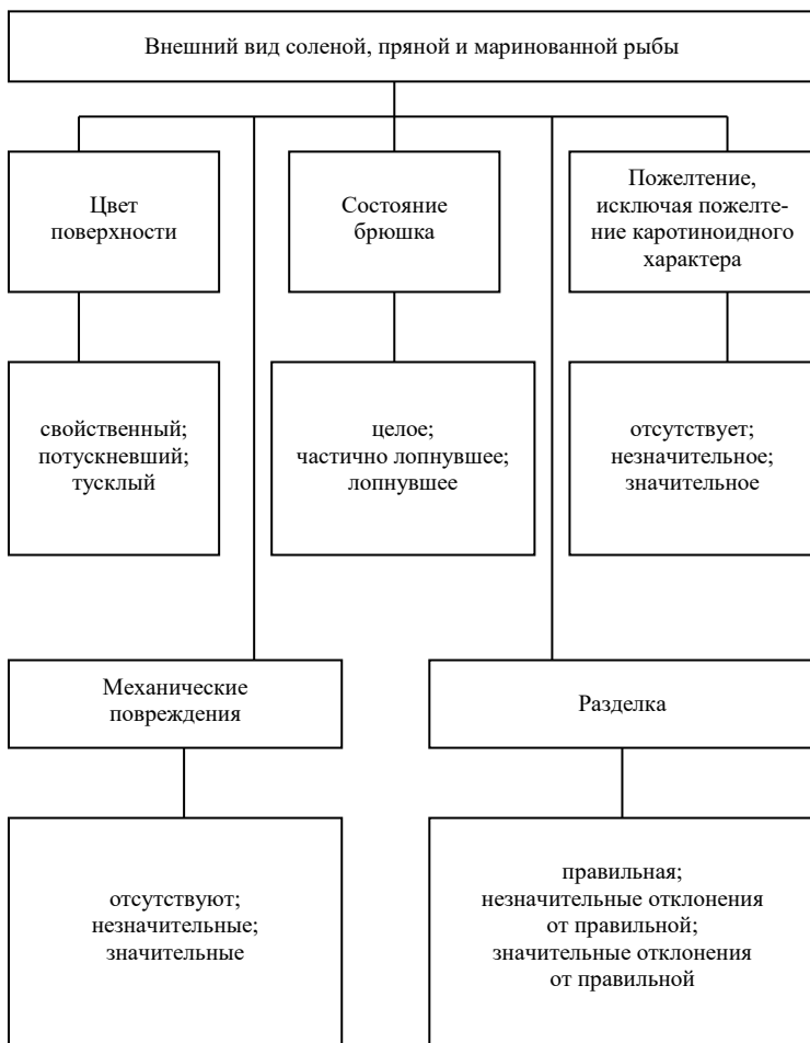
Рис. 2. Оценка внешнего вида соленой рыбы

К незначительным механическим повреждениям относят повреждения легкого характера: царапины, проколы, частичную сбитость чешуи, следы от обезьячевания при отсутствии повреждений мяса, небольшие срывы кожи. К значительным механическим повреждениям относят повреждения головы, надломы жаберных крышек, помятости, побитости, кровоподтеки, укусы.